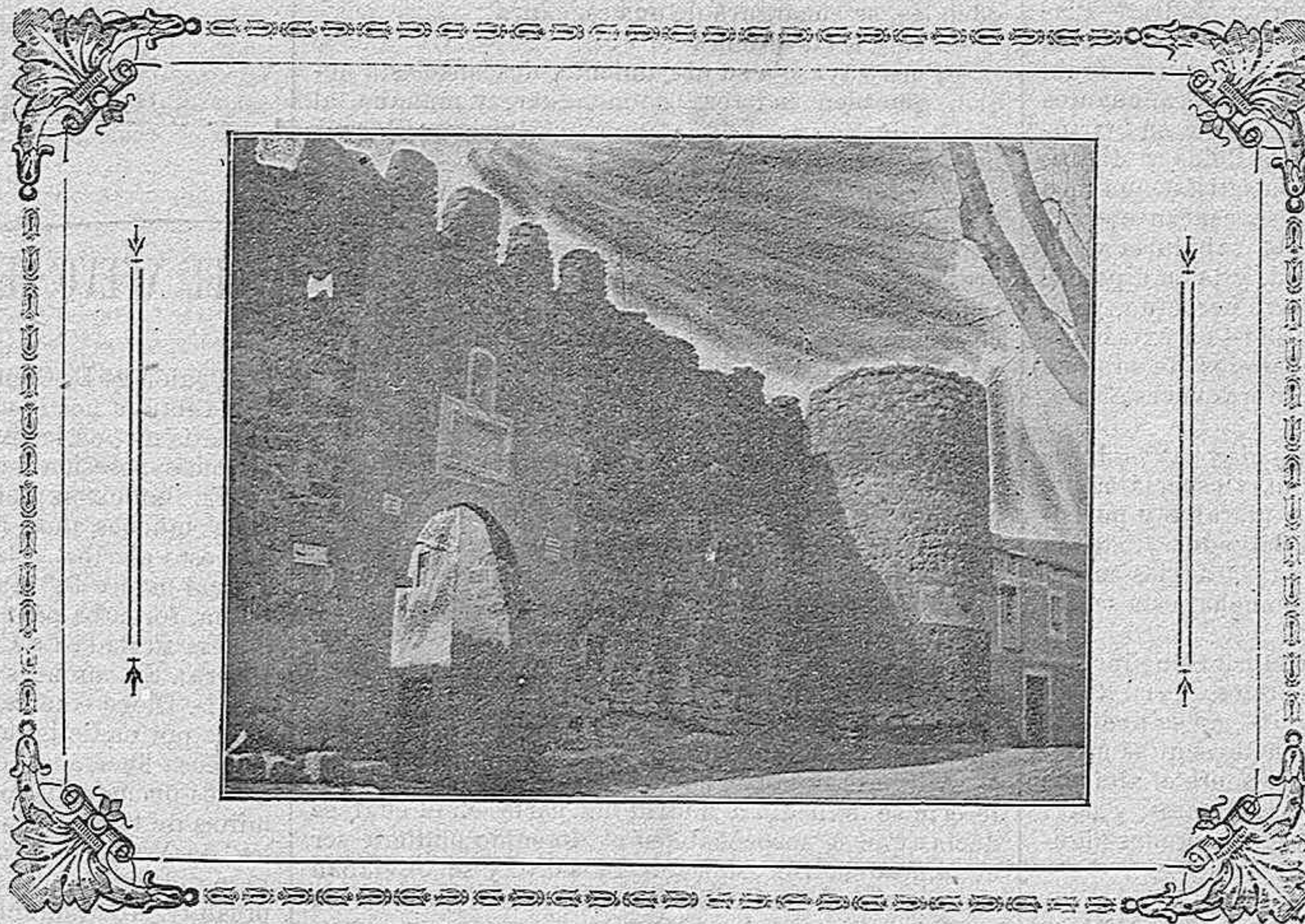
BRIHUEGA: La Puerta de la Cadena

tre otros, los motivos de que tan repetidamente se cometa el delito deplorado.