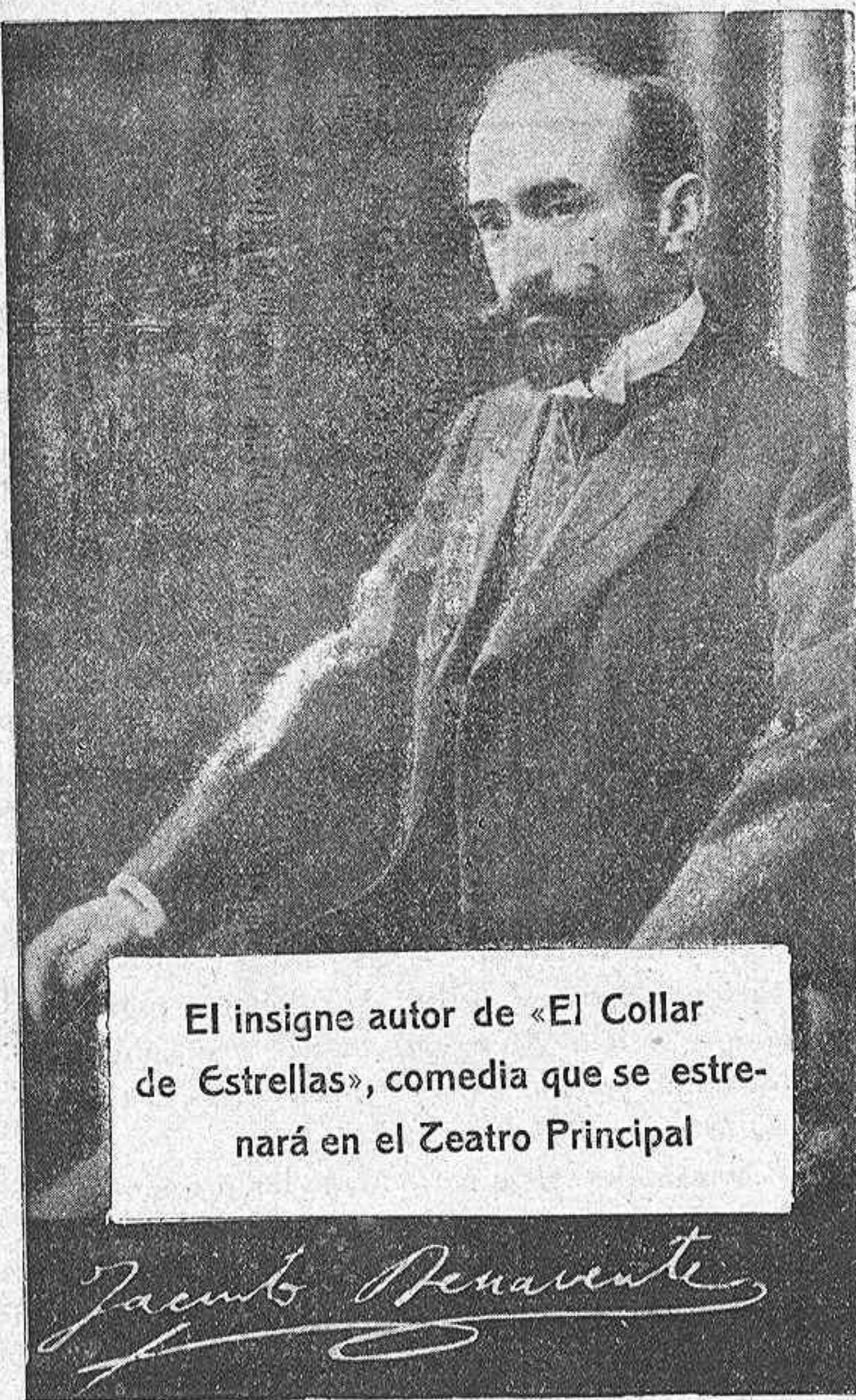
El insigne autor de «El Collar de Estrellas», comedia que se estrenará en el Teatro Principal

—Puede que sí. Después de todo el mundo es benévolo. Podemos respirar. —Y no volver a meternos con el arte: hay cosas intangibles. —¿Es intangible el programa de las fiestas? —¿Por qué? —Acabo de recibirlo ahora. Mira qué chiquitín. Pero no creas, es el oficial firmado y todo por el presidente de la Comisión de fiestas. —Pero, ¿procede del Ayuntamiento? —Procede de un almacén de tejidos y confecciones; ¿qué más da? —El del Ayuntamiento no ha venido todavía. —¿De dónde tiene que venir? —De Cádiz. Todos los ejemplares traerán un letrerito dorado que dice: «Recuerdo del Océano Atlántico.»