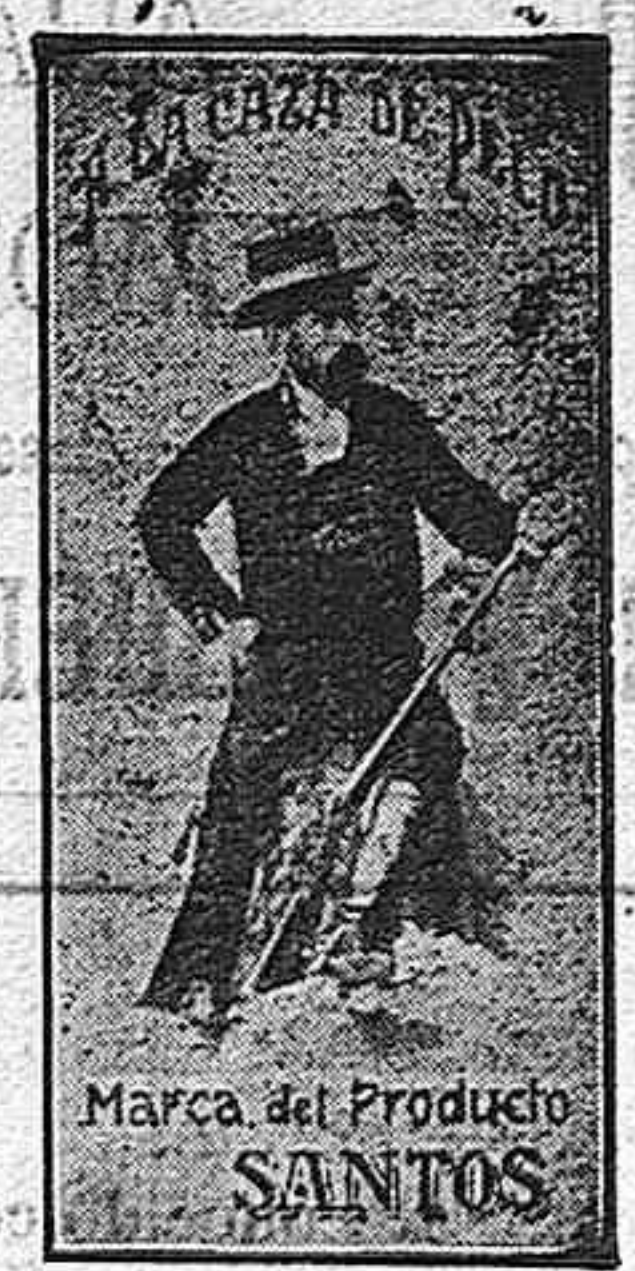
Marca del Producto SANTOS

Se reciben constantemente las últimas novedades en tarjetas postales.