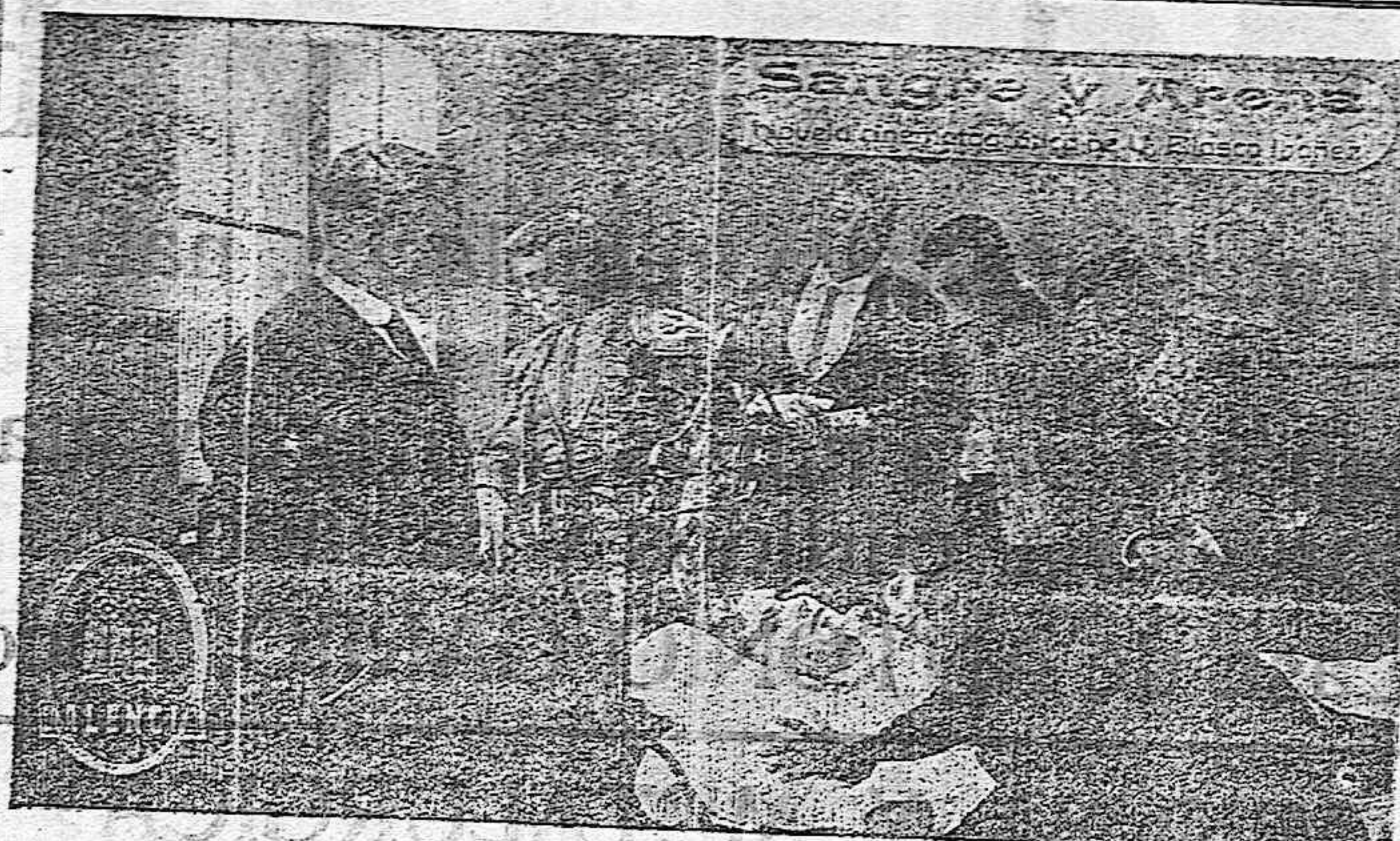
«LA MUERTE DE JUAN GALLARDO»