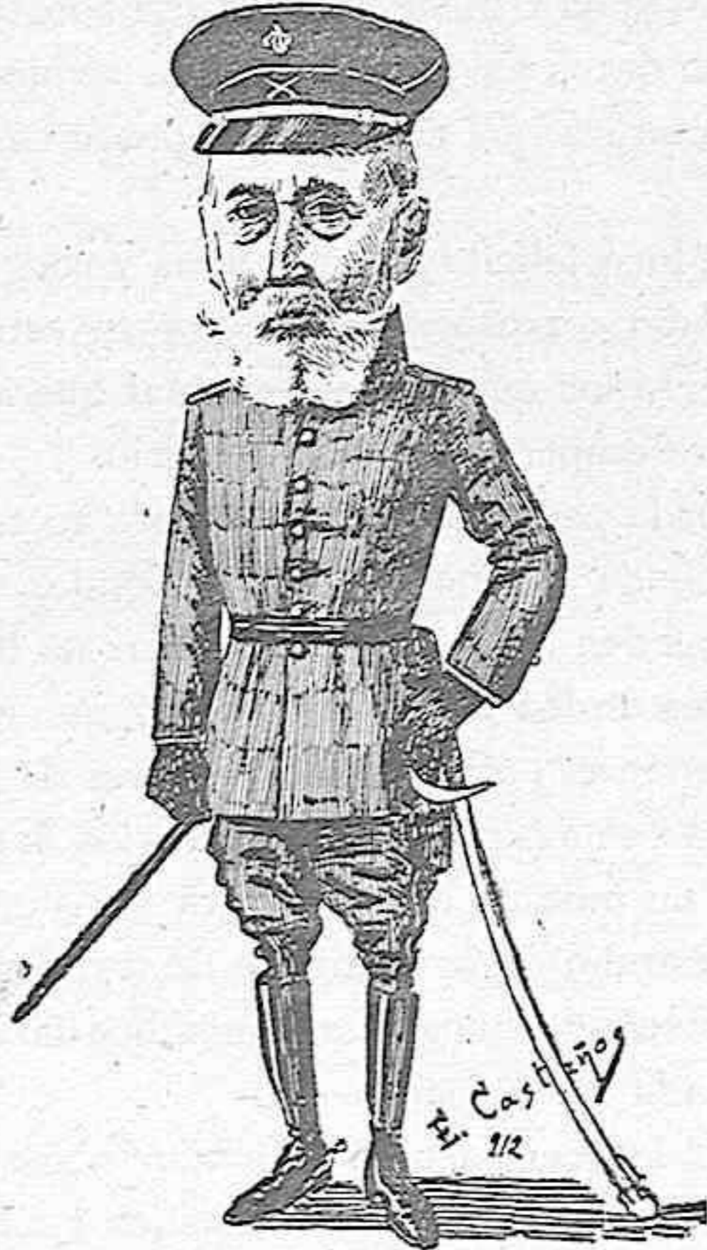
El militar que manda esta plaza.