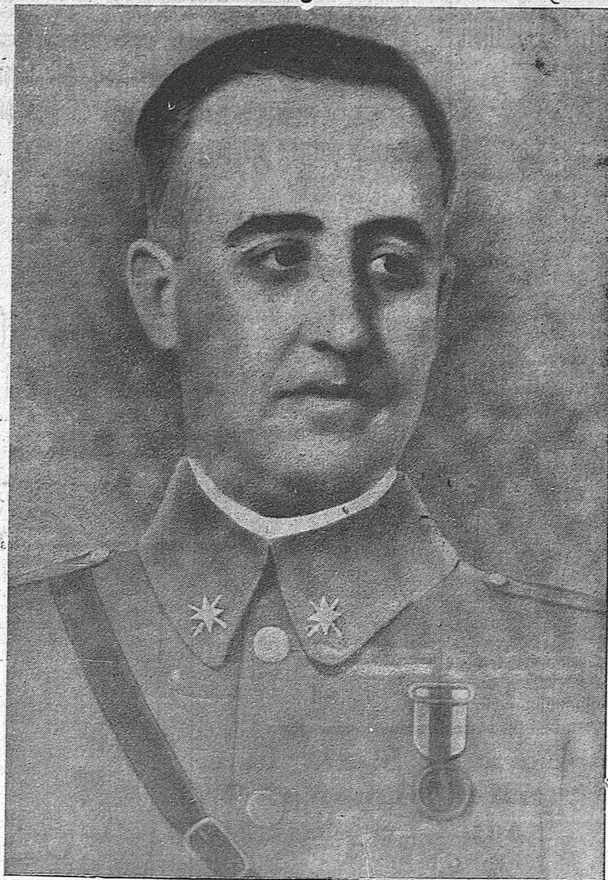
Generalísimo Franco, Jefe del Estado Español, conductor y alma de la España Nacional, a quien rendimos en esta hora, en la víspera de la victoria final, el homenaje de nuestra más alta admiración