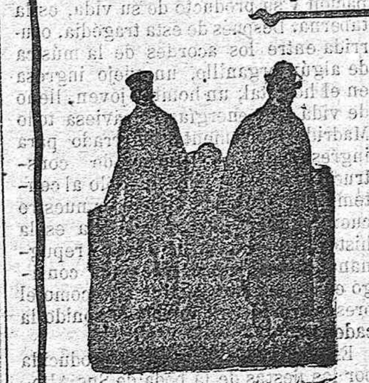
Fig. 40.—Traje de piel negra, cuello de paño, forrado todo en franela, 100 pesetas. Solo la americana, 60 ptas.

De nuestro catálogo de prendas de caza, campo y sport.