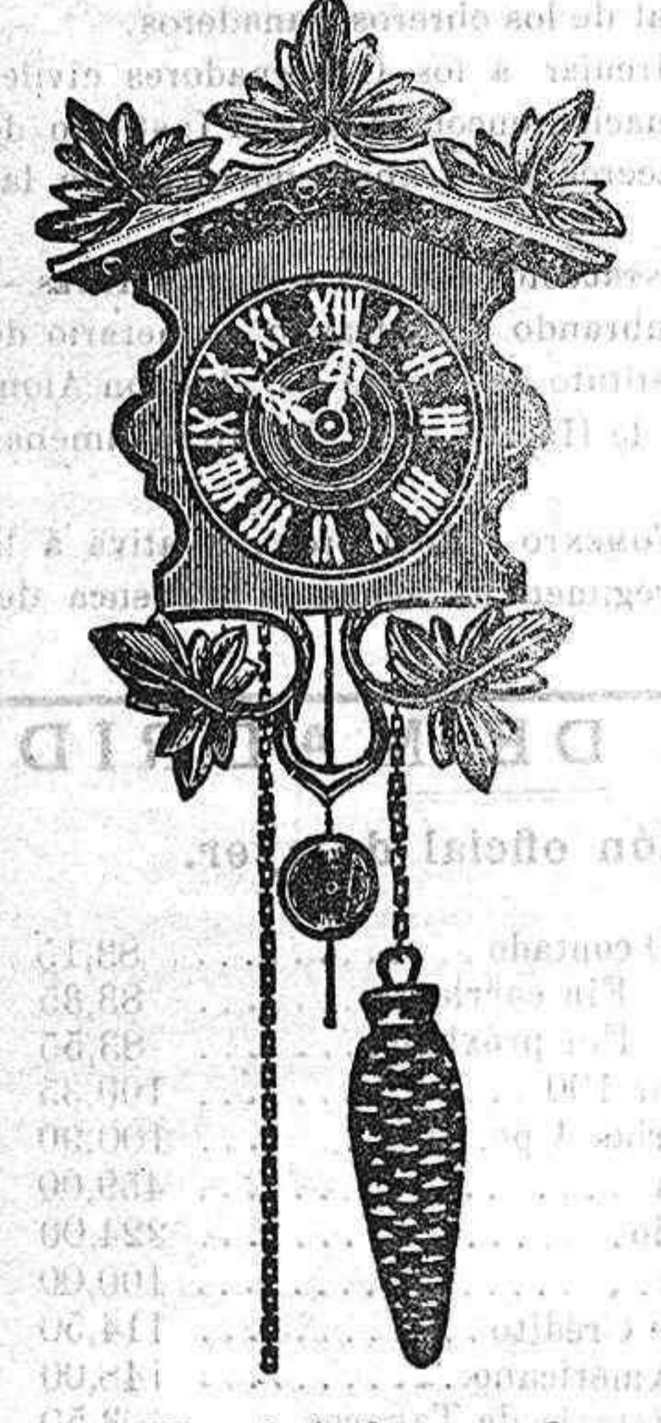
El reloj de regalo para los suscriptores de Heraldo Toledano.

DIARIO POLÍTICO AMPLIA INFORMACIÓN EXTRANJERA Y DE MADRID