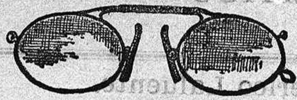
CRISTALES SUELTOS Y PIEZAS DE RECAMBIO

Anteojos de cristal de Roca desde 8 pesetas.