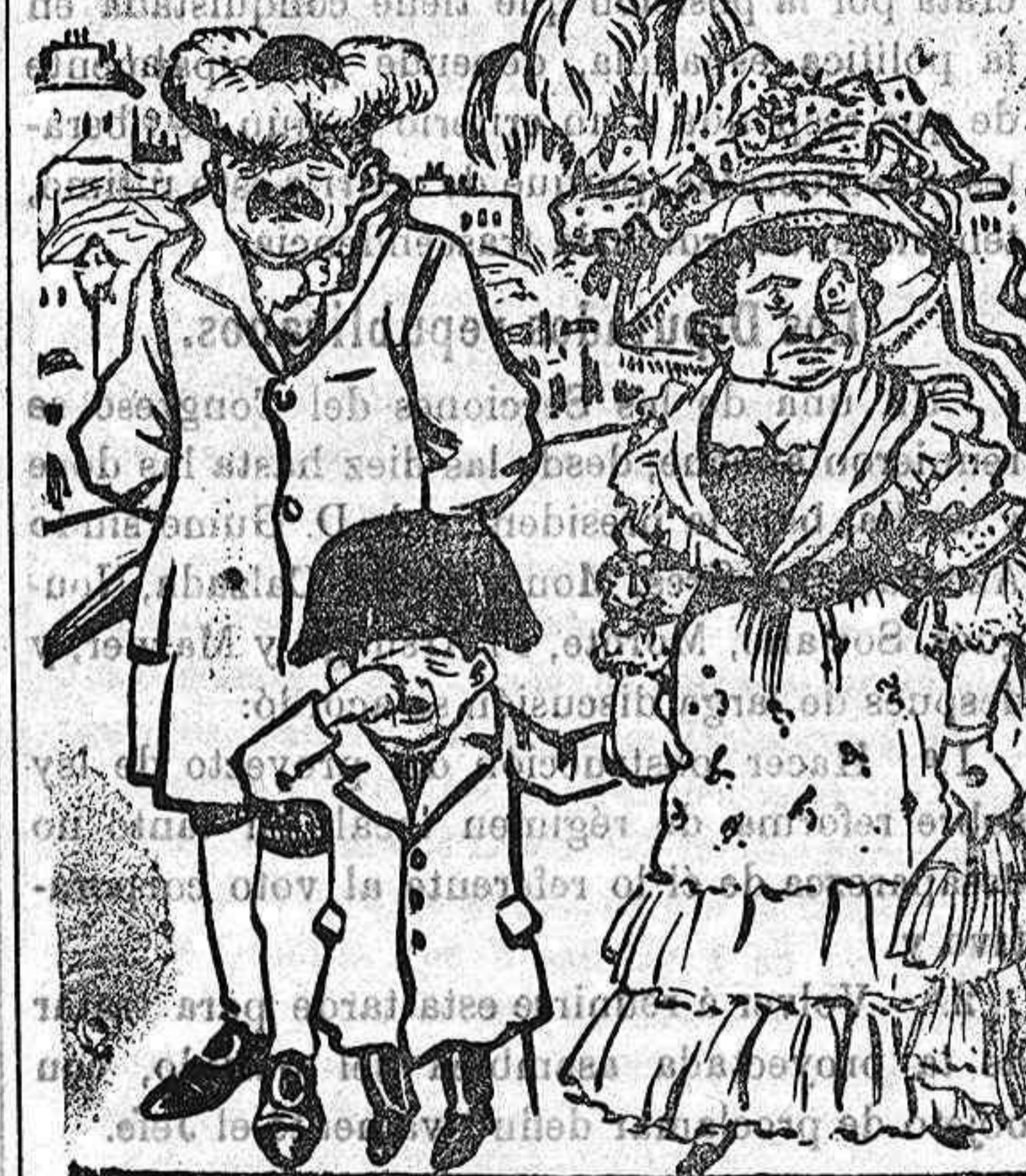
El gran Napoleón, el genio de la guerra, llorando porque su mamá no le ha dado un conejito y su papa le ha prometido azotes.