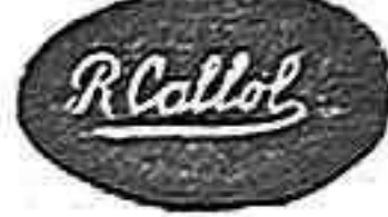
Fig. 3.ª.—Tamaño natural