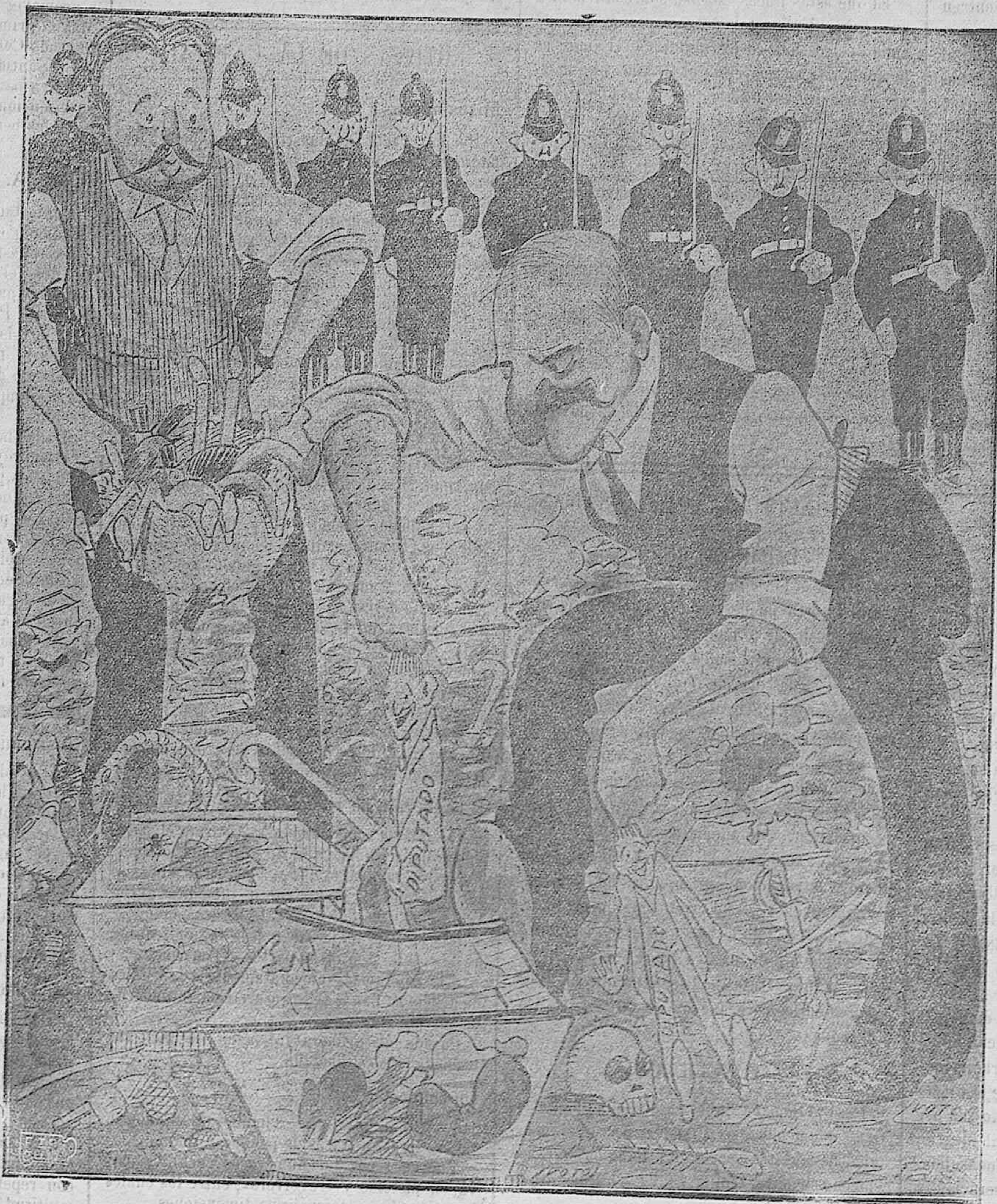
HACIENDO EL ESCRUTINIO