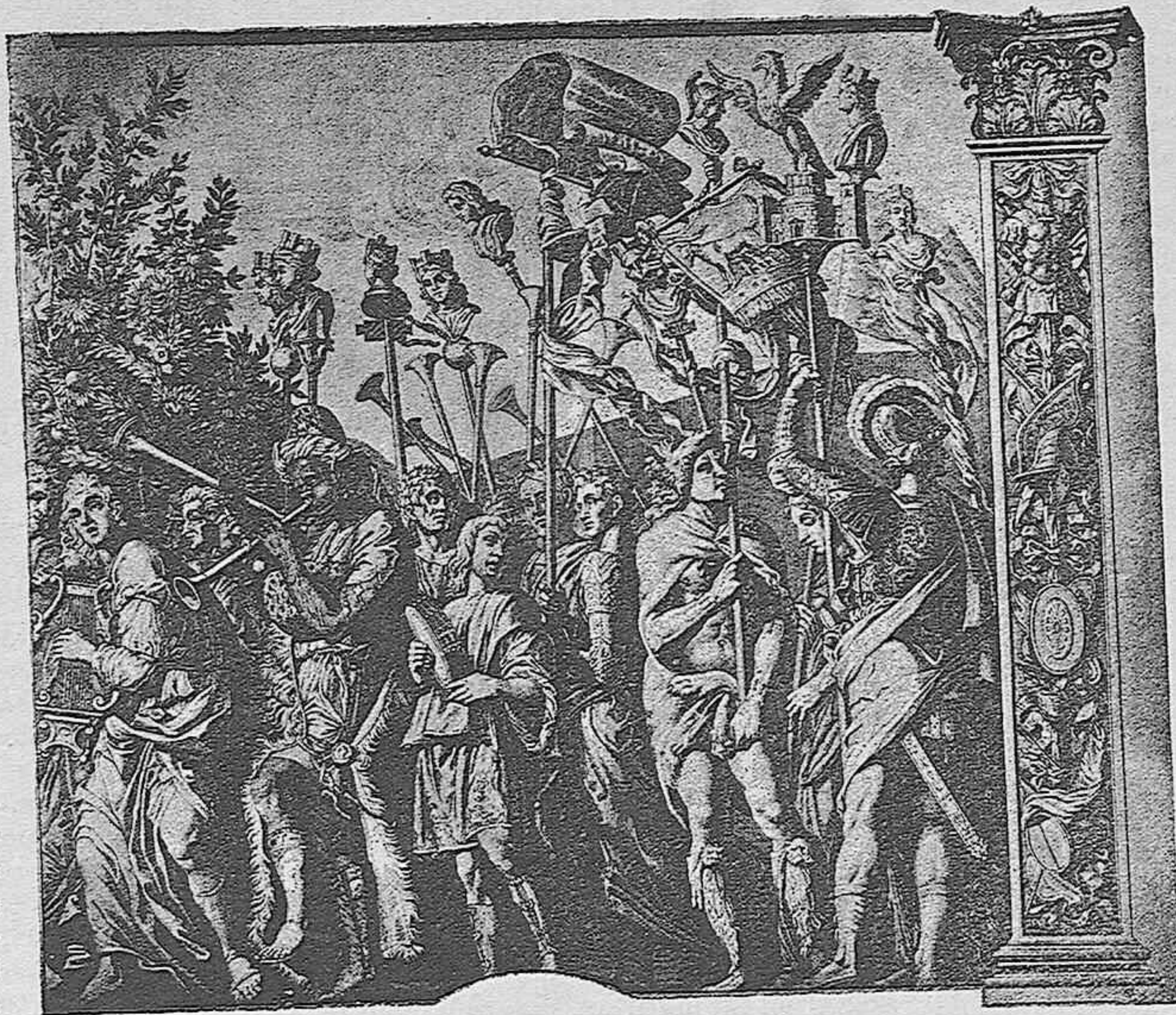
Fragmento de una estampa italiana del siglo XVI

Altísimas y graves consideraciones exigen, con efecto, en todos los países bien organizados, que se construya el material de guerra por cuenta del Estado. Proveerse de él en otras naciones, sobre el inconveniente del mayor coste, ofrece