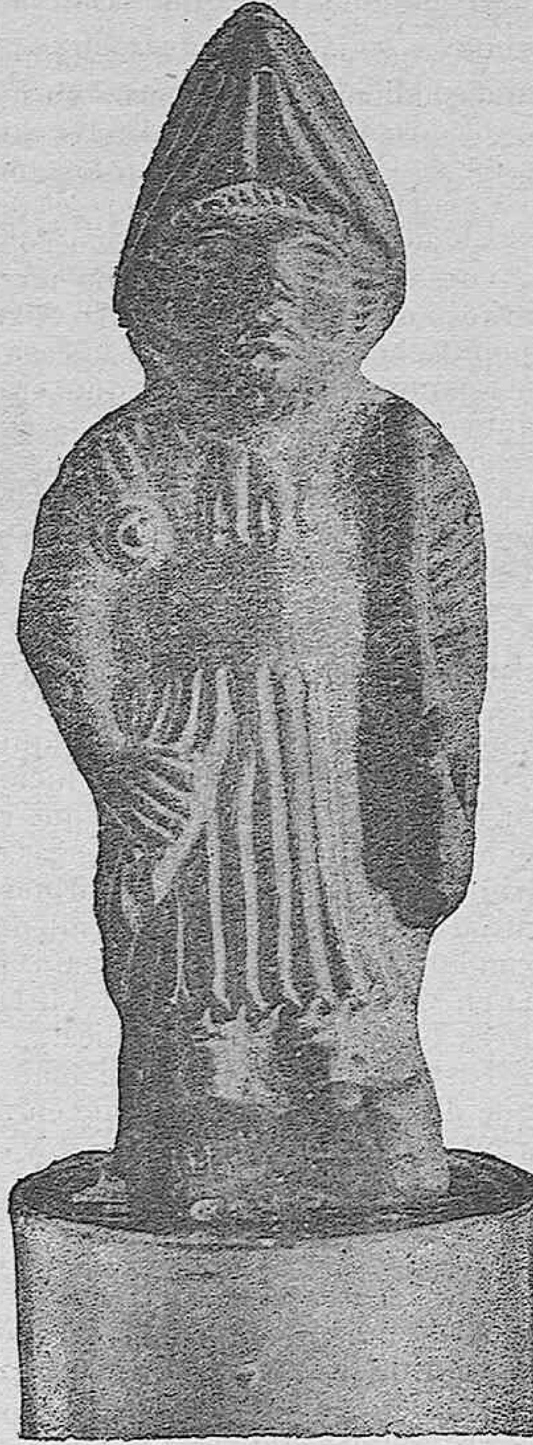
Figura de barro cocido

Conste, pues: 1.º, que entre los datos que puede recoger sobre la demolición del resto del palacio, no hay ninguno referente al dictamen contrario de la Comisión, á quien aplaudo en este asunto; 2.º, que sigo lamentando el silencio, casi el secreto, en que ésta guarda sus trabajos; y 3.º, que repito lo que muchos me