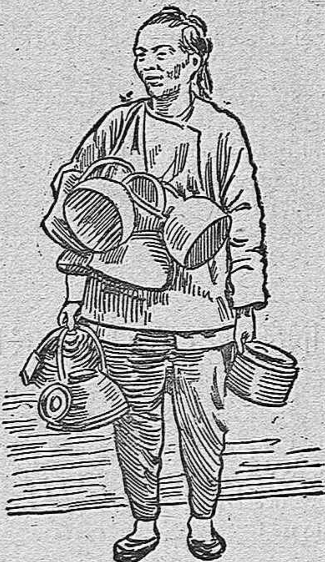
Un vendedor ambulante.

dirán algunos con murria. —¡Ese que se meta á ciego y se compre una bandurria!