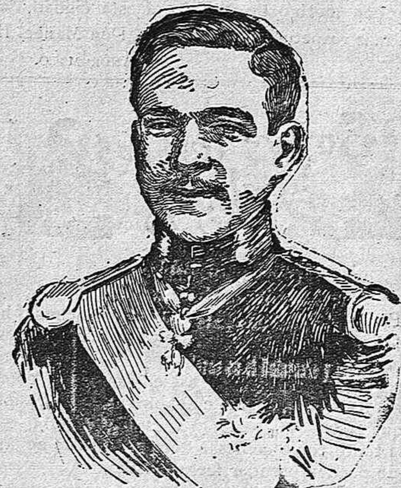
El rey de Portugal D. Manuel II.

Hoy visitará nuestra capital el monarca lusitano acompañado de los aristócratas del vecino reino, sus ayudantes y nuestro rey, con lucido acompañamiento.