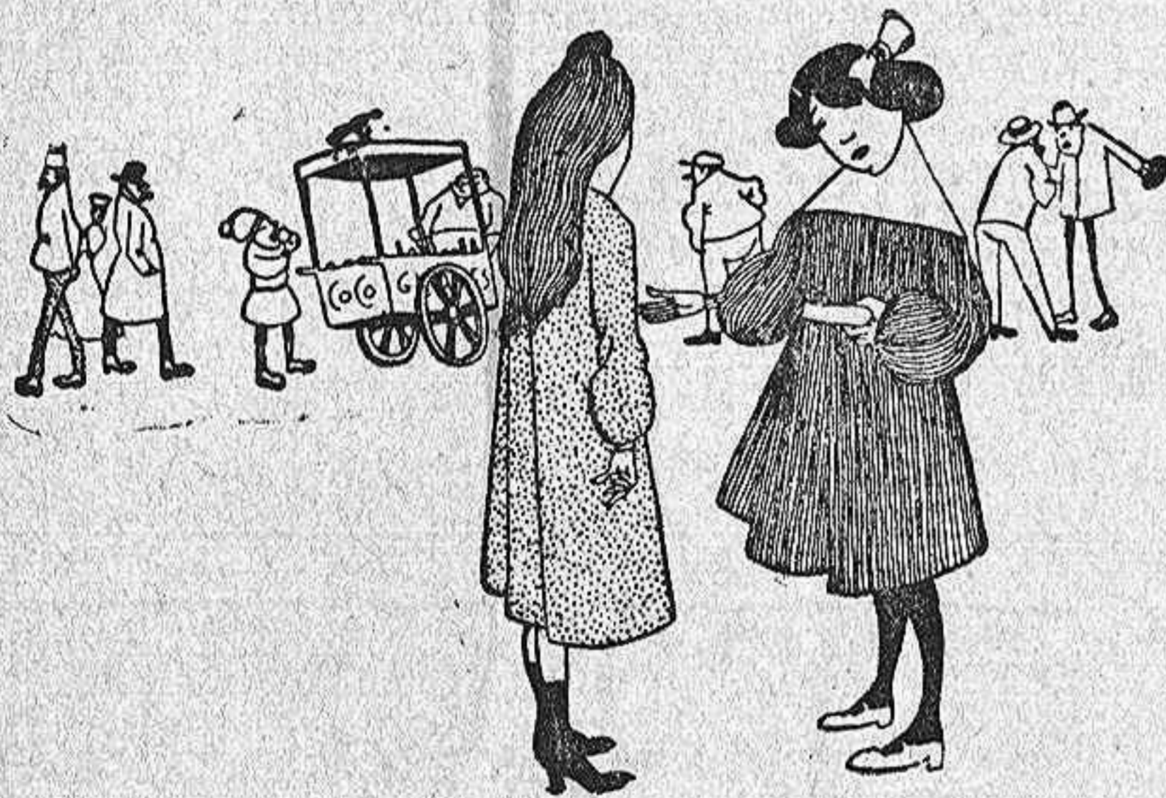
(Dibujo de J. Hemard)

—Estoy desesperada, amiga mía. Mírale allá abajo; ahora le ha dado por la bebida.