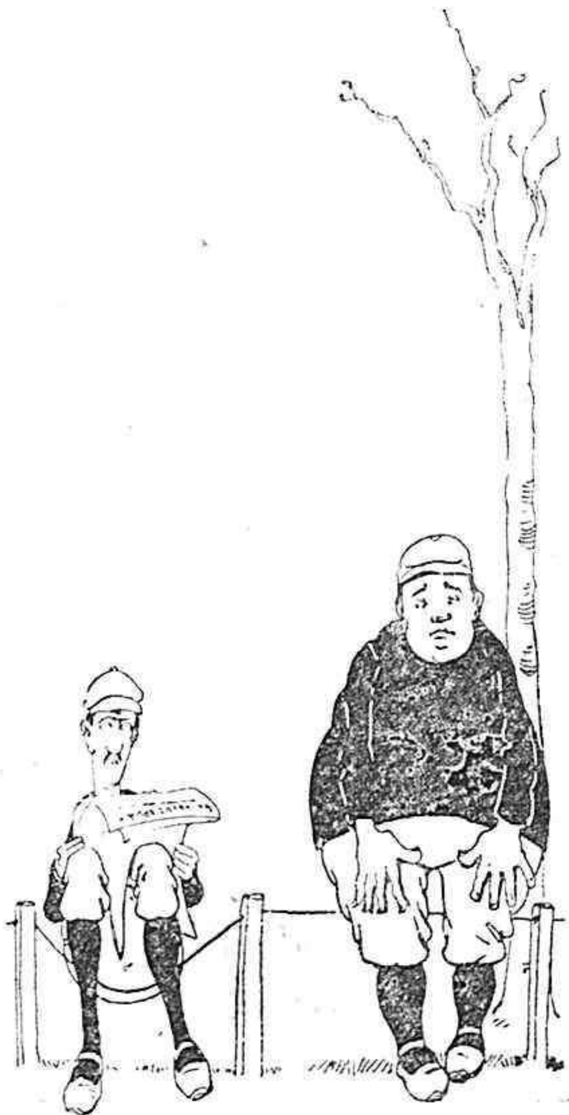
—Con permiso de usted.