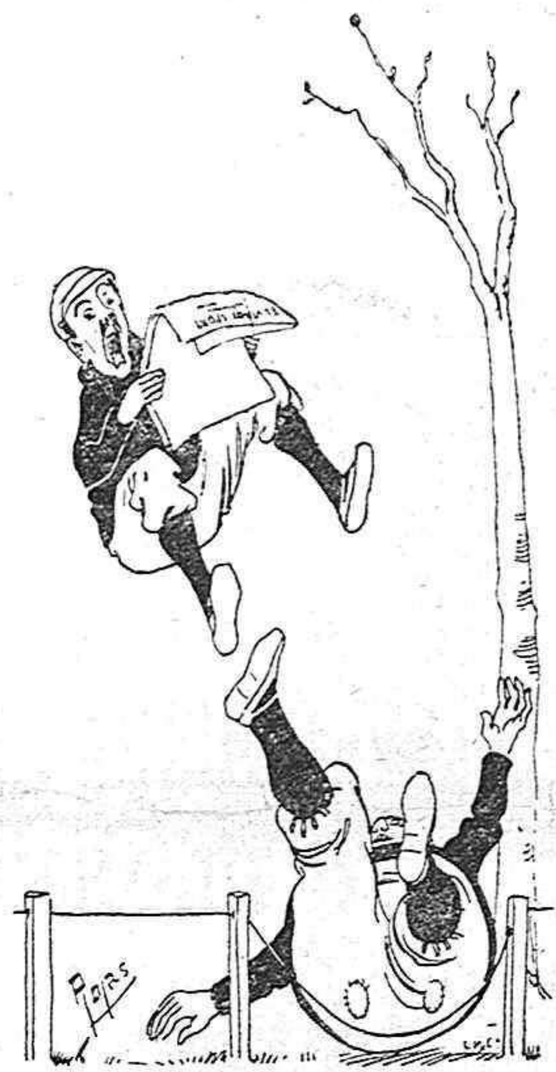
—¡Usted lo tiene!!!

¿Es fuerte, conoce su situación y su valía, mide la distancia que le separa de cuantos le rodean, distingue los verdaderos entusiasmos de la torpe adulación y la sagaz envidia? Pues los mismos que á la fuerza le admiran y ensalzan, le tildarán de pretencioso, haciendo resaltar siempre, con sus cualidades innegables, su falta de corazón y sobra de orgullo. El genio, receloso, pliega sus alas, y oyendo los vitores de la muchedumbre que de él vive alejada, tristemente vegeta, siempre sólo y cansado, sin que la dulce intimidad y los halagos nobles de otros espíritus le ayuden á llevar su pesada carga, proporcionando á su alma ese manjar delicioso de simpatías y afectos íntimos que de los mayores trabajos nos redime y entre las mayores angustias nos consuela.