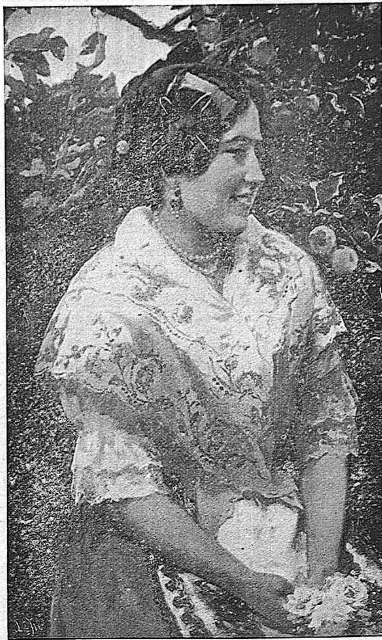
UNA VALENCIANA. (Cuadro de Ramirez.)

Pero el príncipe Fouson contestó heroicamente que la piedad filial le obligaba á obedecer, sin examen ni discusión, una orden revestida con el sello paternal, y sin vacilar un instante se hundió el puñal en el pecho.