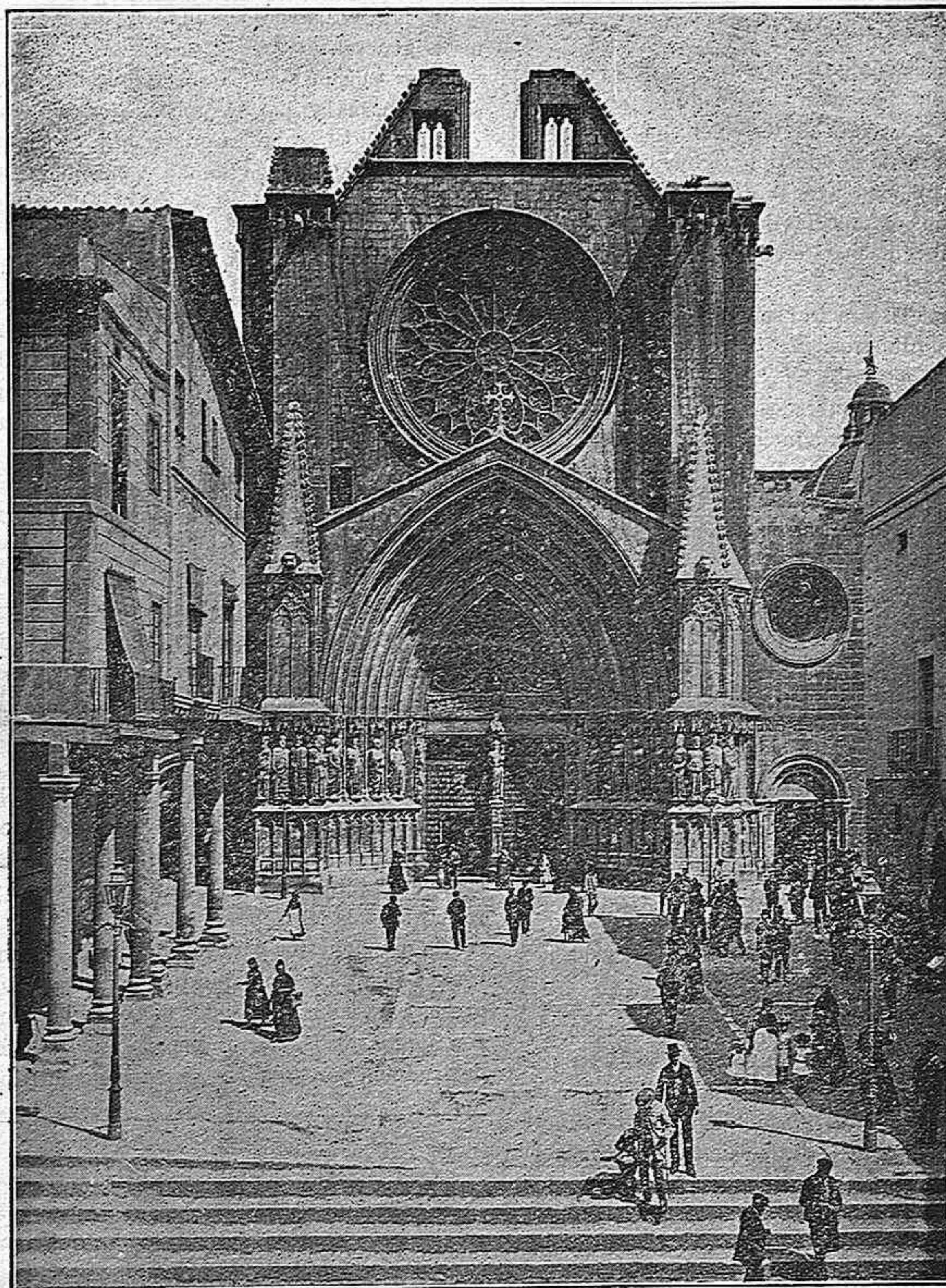
CATEDRAL DE TARRAGONA.