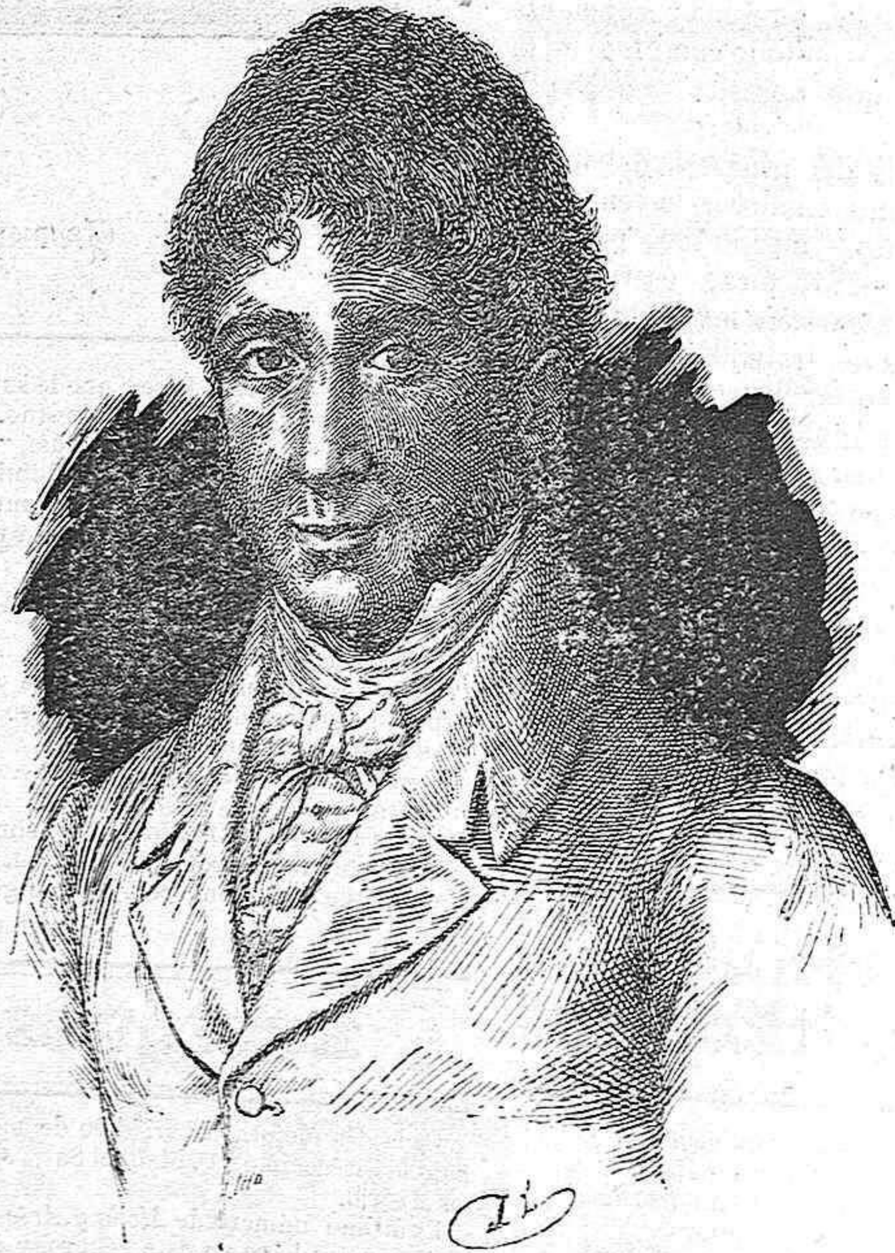
D. Isidoro Máiquez.