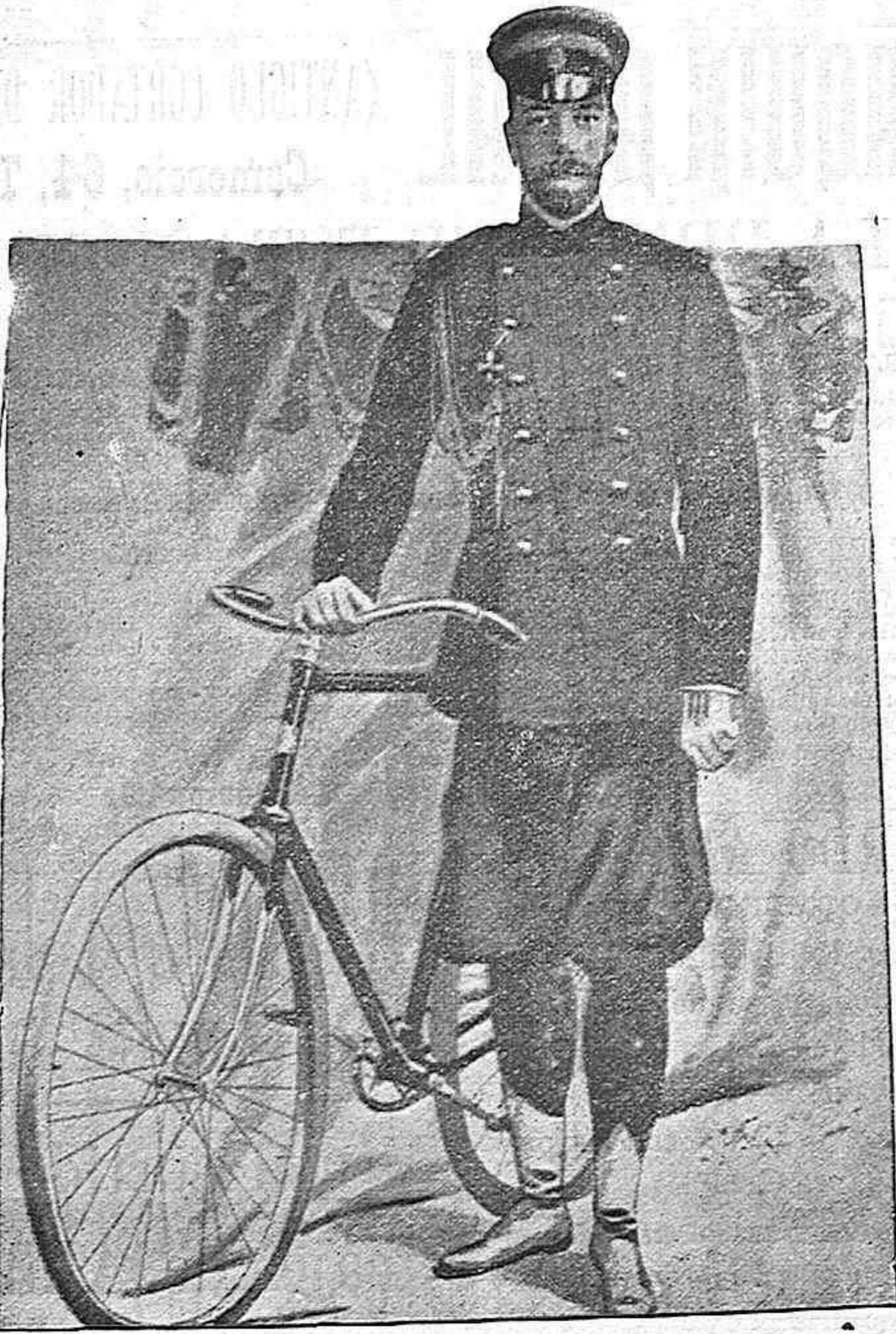
El czar de Rusia.

eido el programa de las enseñanzas del presente curso produjo el anuncio de que ocuparía cátedra el sabio profesor.