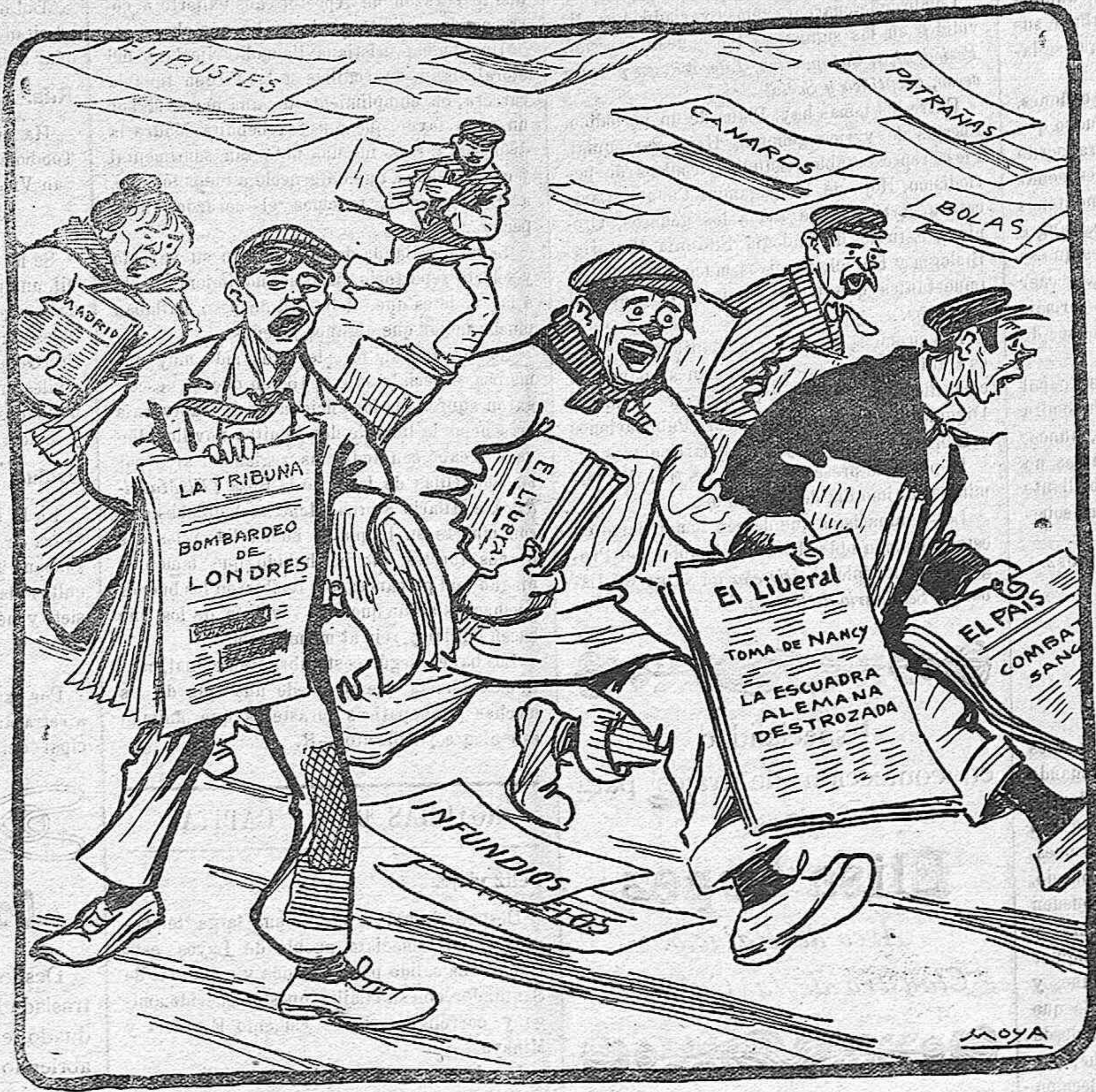
(De El Fusil).

Como no cuesta trabajo, a ver el que puede más lanzan bolas a destajo, por arriba, por abajo, por delante y por detrás!