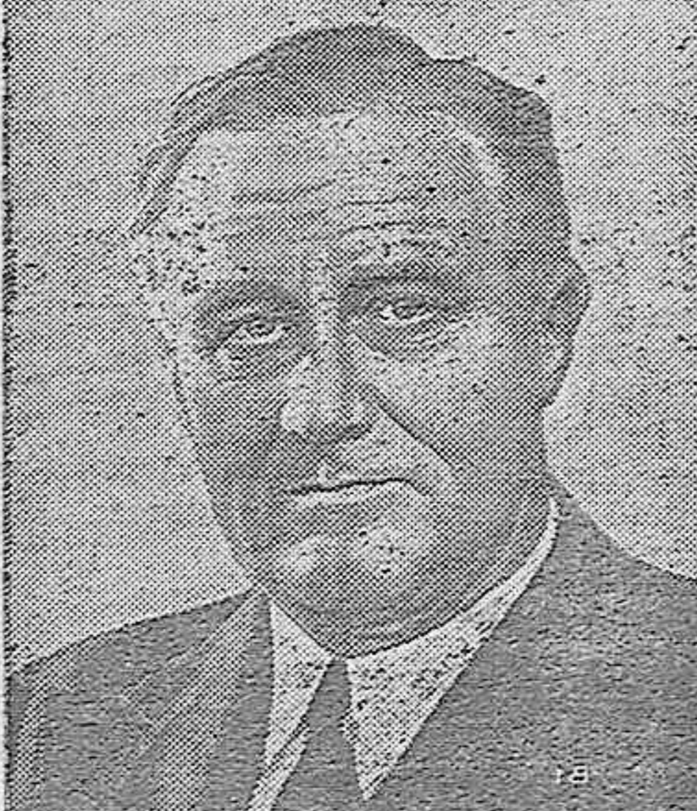
PRESIDENTE ROOSEVELT, que ha pedido plenos poderes al Congreso.