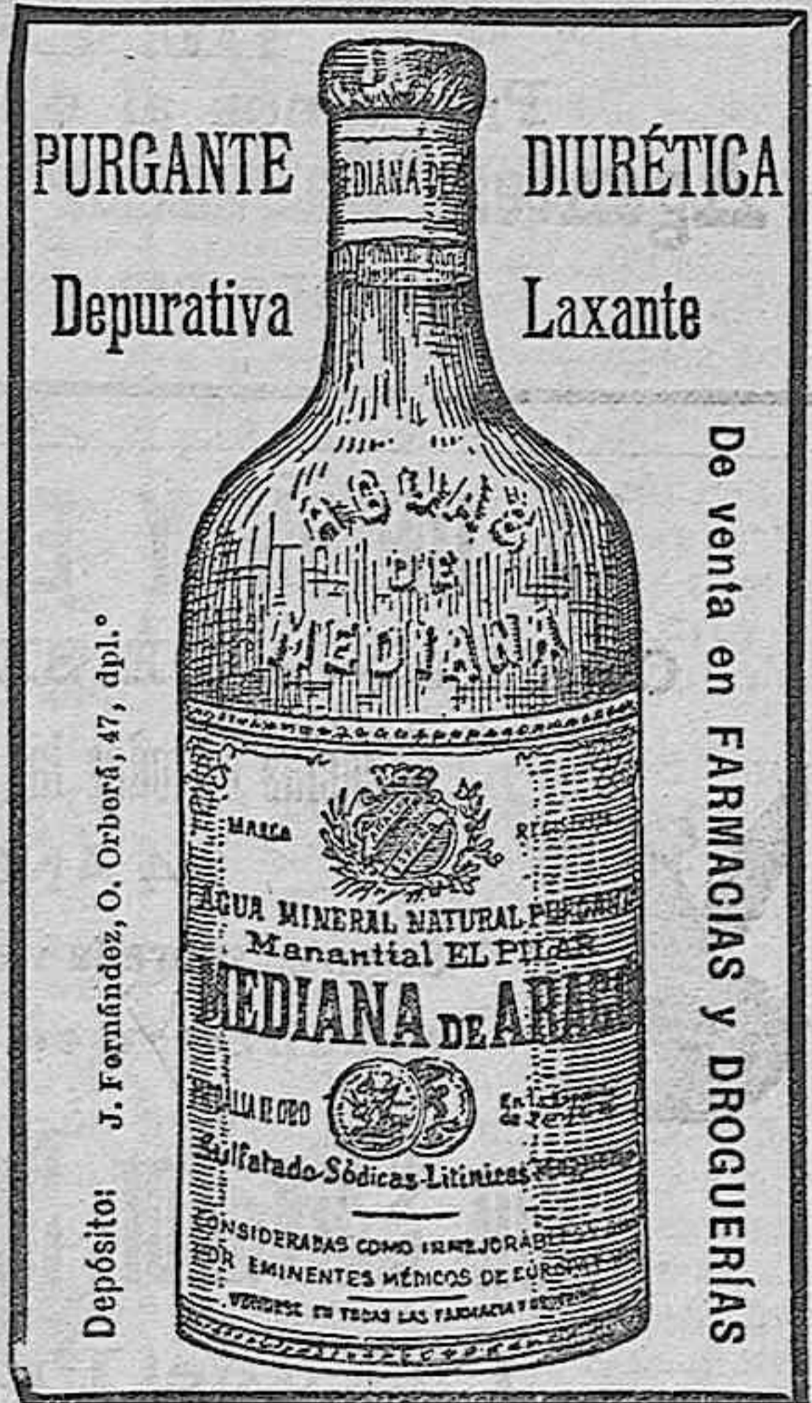
Imprenta de El Radical

Ignórase si han ocurrido desgracias personales. Conan-Doyle grave. Desde Londres comunican los corresponsales, que el célebre escritor inglés, Conan-Doyle, se encuentra enfermo de gravedad. La casa del insigne literato está siendo visitadísima por todos los escritores de aquella capital. Asimismo no cesan de recibirse telegramas de toda Europa interesándose por el estado del gran escritor. ALMODOBAR. Libras esterlinas. COTIZACION EN ALMERIA. El 13 de Enero de 1909. PAGARON (27'93 cheque, 27'87 á 8 div. Salvador Romero y Hermano. RANQUEROS. Paseo del Príncipe, número 16. Venta de una finca. Por no poderla manejar se vende una finca de cincuenta tabullas de riego y muchos ensanches, con parrales, huerto de naranjos y frutales, casa cortijo, noria, balsa, un arte de viento y tres horas de agua de Fuente. Razón en Almería: Alvarez de Castro, 1, principal. Venta á plazos. Se vende la casa núm. 63 de la calle de Ramos. La venta se hace al contado ó á plazos, como mejor convenga al comprador. Para más detalles en la misma casa, de nueve á diez de la mañana y de cuatro á seis de la tarde.