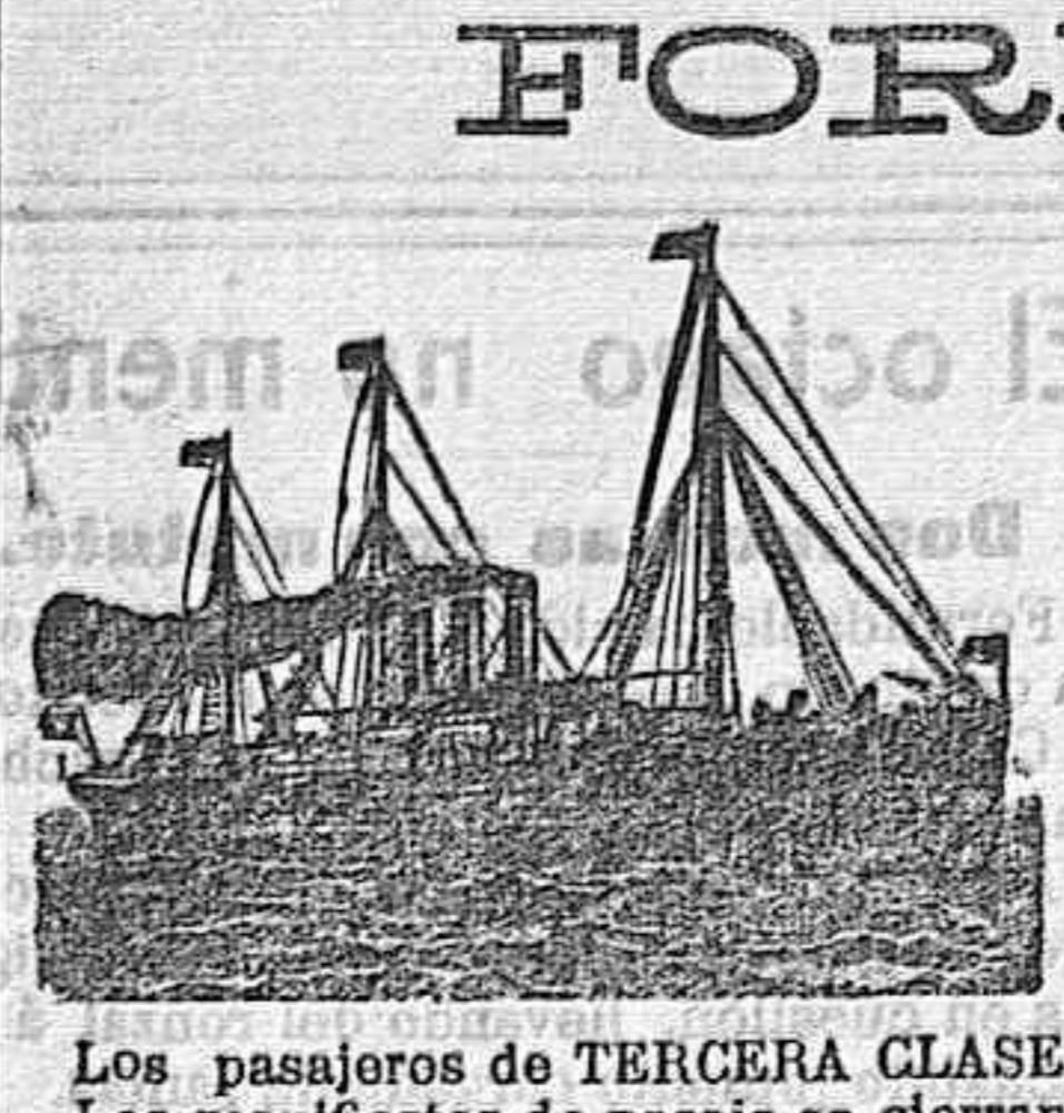
Los pasajeros de TERCERA CLASE mandarán con bastante anticipación, los documentos que ordena la vigente Ley de Emigración...

Société générale de Transports Maritimes à Vapeur. Servicio fijo, rápido y directo el día 12 de cada mes por el puerto de Almería para el transporte de Pasajeros con destino al BRASIL Y BUENOS AIRES (AMÉRICA DEL SUR).