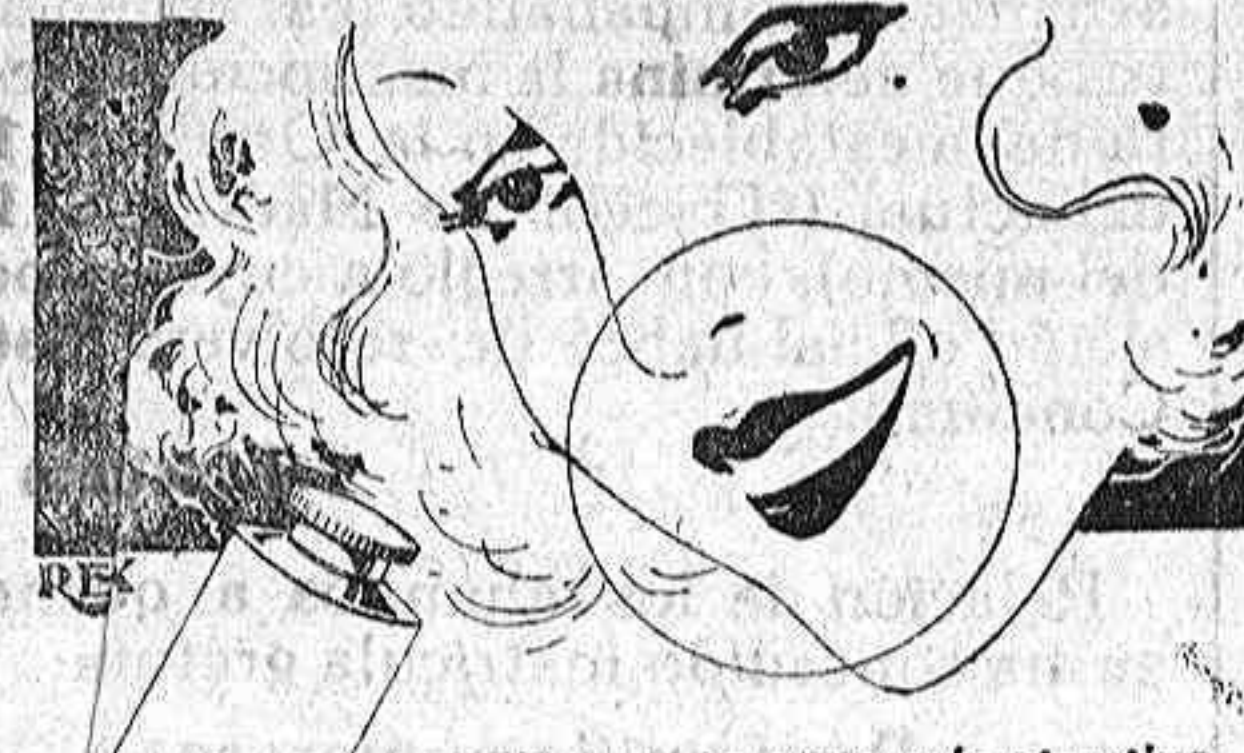
La boca es la parte más atractiva y más interesante de la cara. Cuidela con esmero, limpiandola a diario con