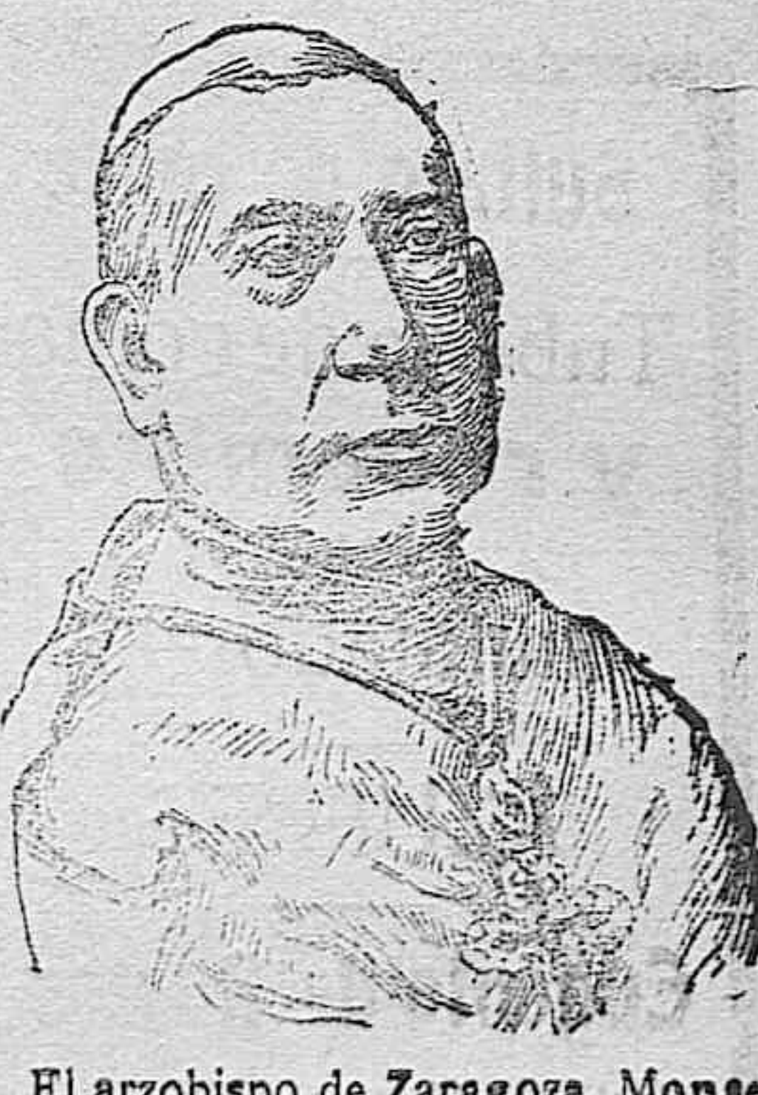
El arzobispo de Zaragoza Monseñor Soldevilla, que ha llegado a Roma para serle impuesto el papel cardenalicio por su S. S. el Papa.