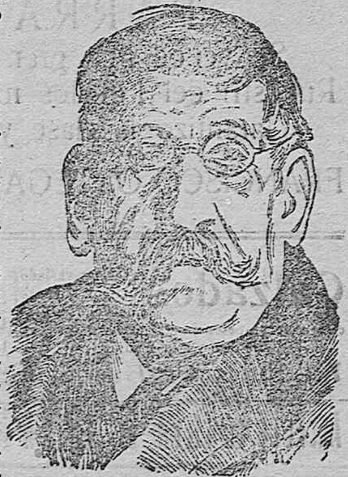
Último retrato del insigne escritor don Benito Pérez Galdós, que acaba de fallecer en Madrid