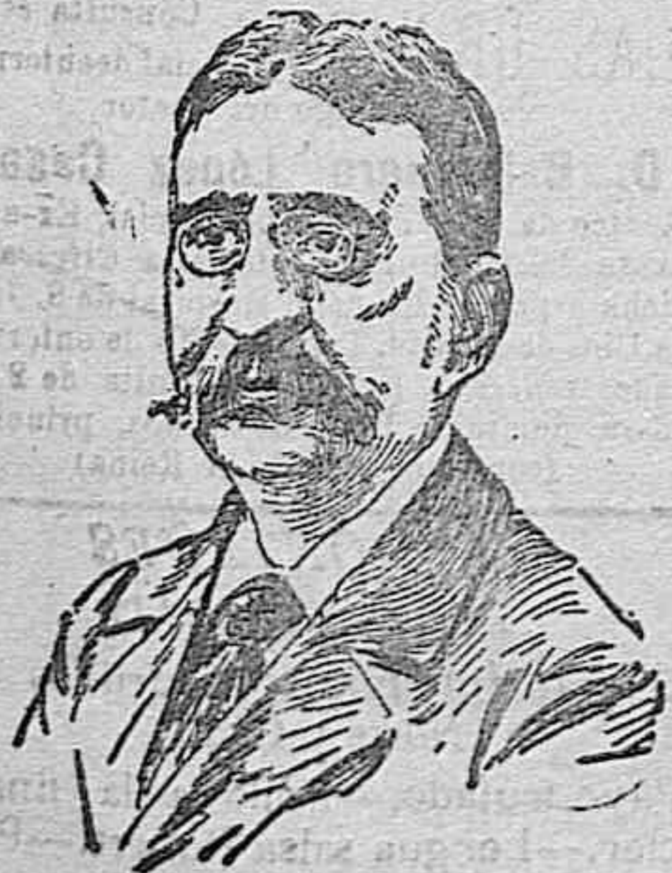
Mr. Pichon, notable político francés que se dice se retira a la vida privada

El Ayuntamiento de Almería se ha ocupado de este asunto en su última sesión, suscitándose un debate en el que sobre poco más o menos se dijo lo que hemos dejado expuesto en las anteriores líneas