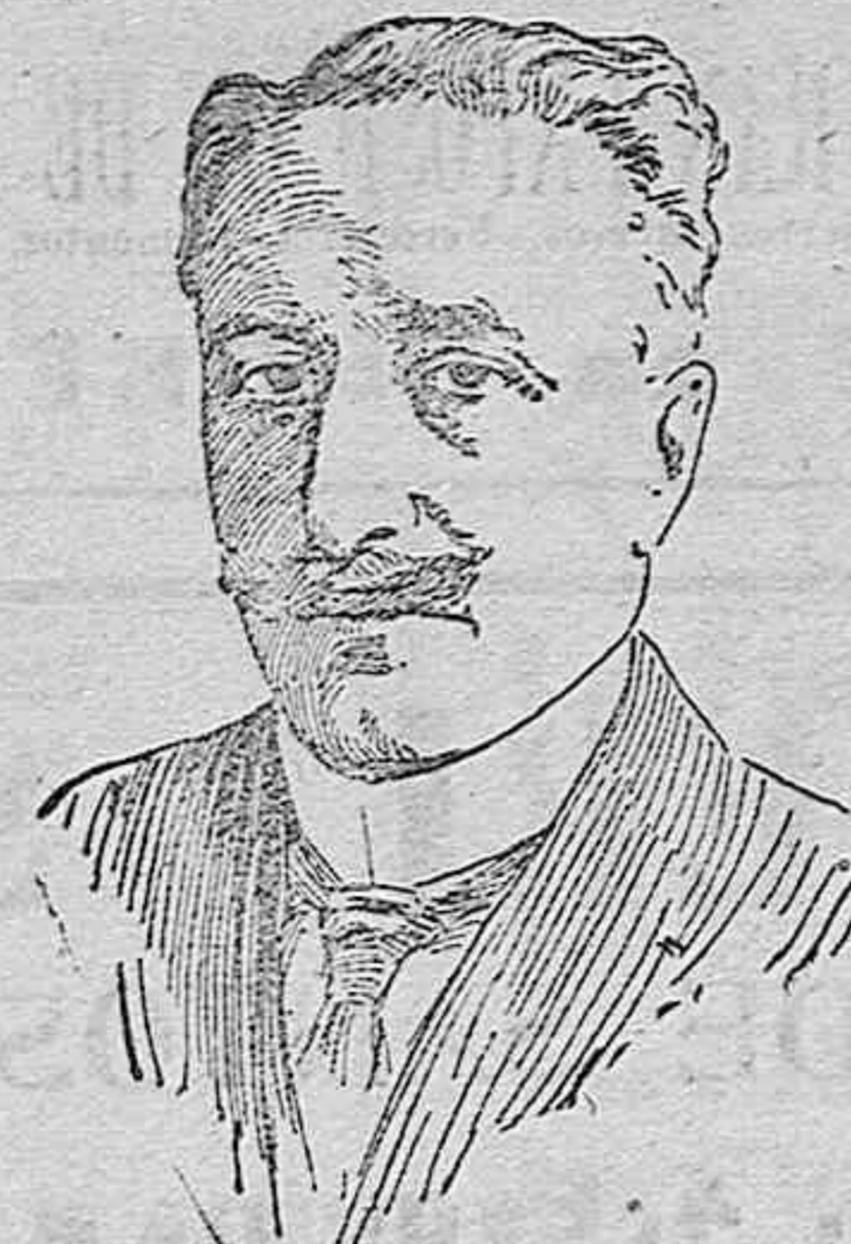
Paul Deschan I, presidente de la Cámara de diputados francesa, que ha renunciado a un discurso por el que ha sido muy felicitado.