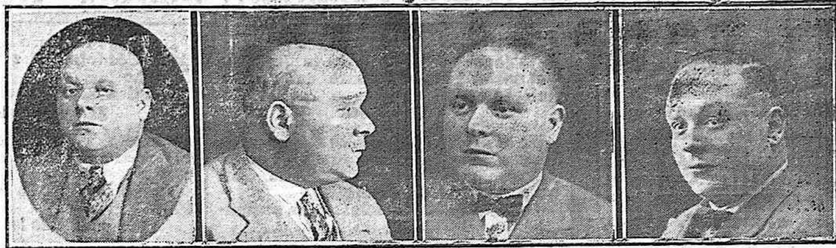
Calvo 18 años 5 meses tratamiento 8 meses tratamiento 12 meses tratamiento

J. MOURADD, Miembro Honorario del Jurado de Sanidad de Paris y Londres