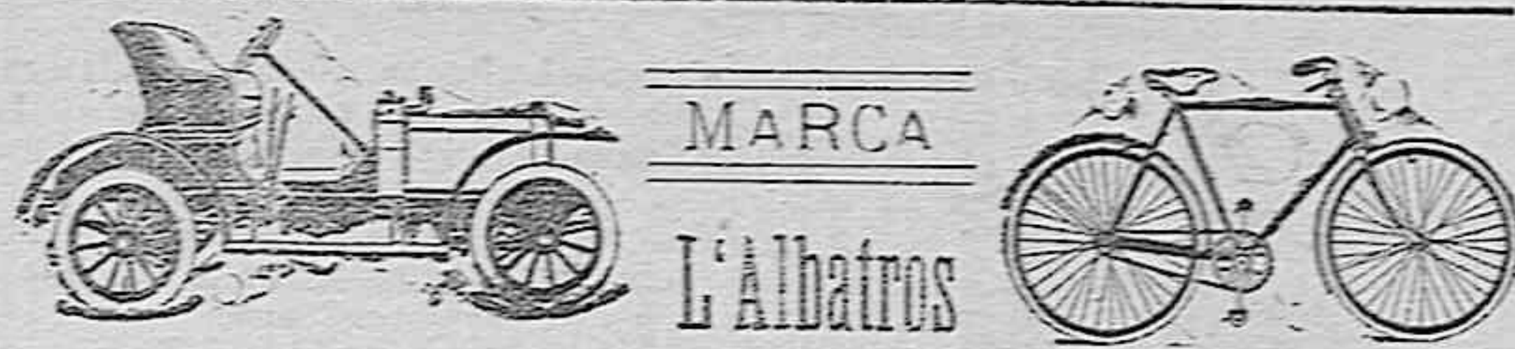
De la gran fabrica de Henri Billouin. Ingeniero Constructor.-PARIS

Proveedor del Palacio del Eliseo, de los ministerios de la Guerra y Agricultura y demás dependencias del Estado francés; del Circulo militar de Paris y de todas las grandes administraciones.