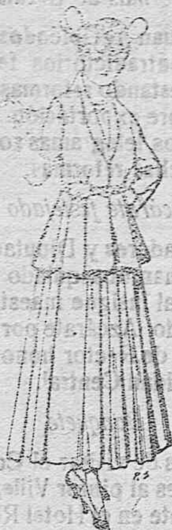
Trajes de lana negra, azul y de color, para señora. A pesetas 85,