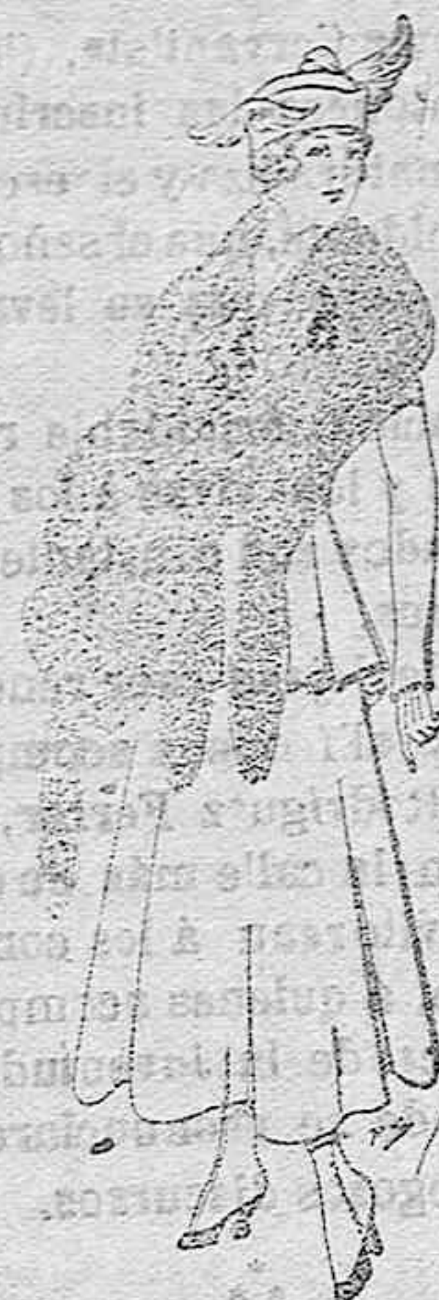
Juego de pieles imitación perfecta al renar-negro. De pts. 40 á 4d