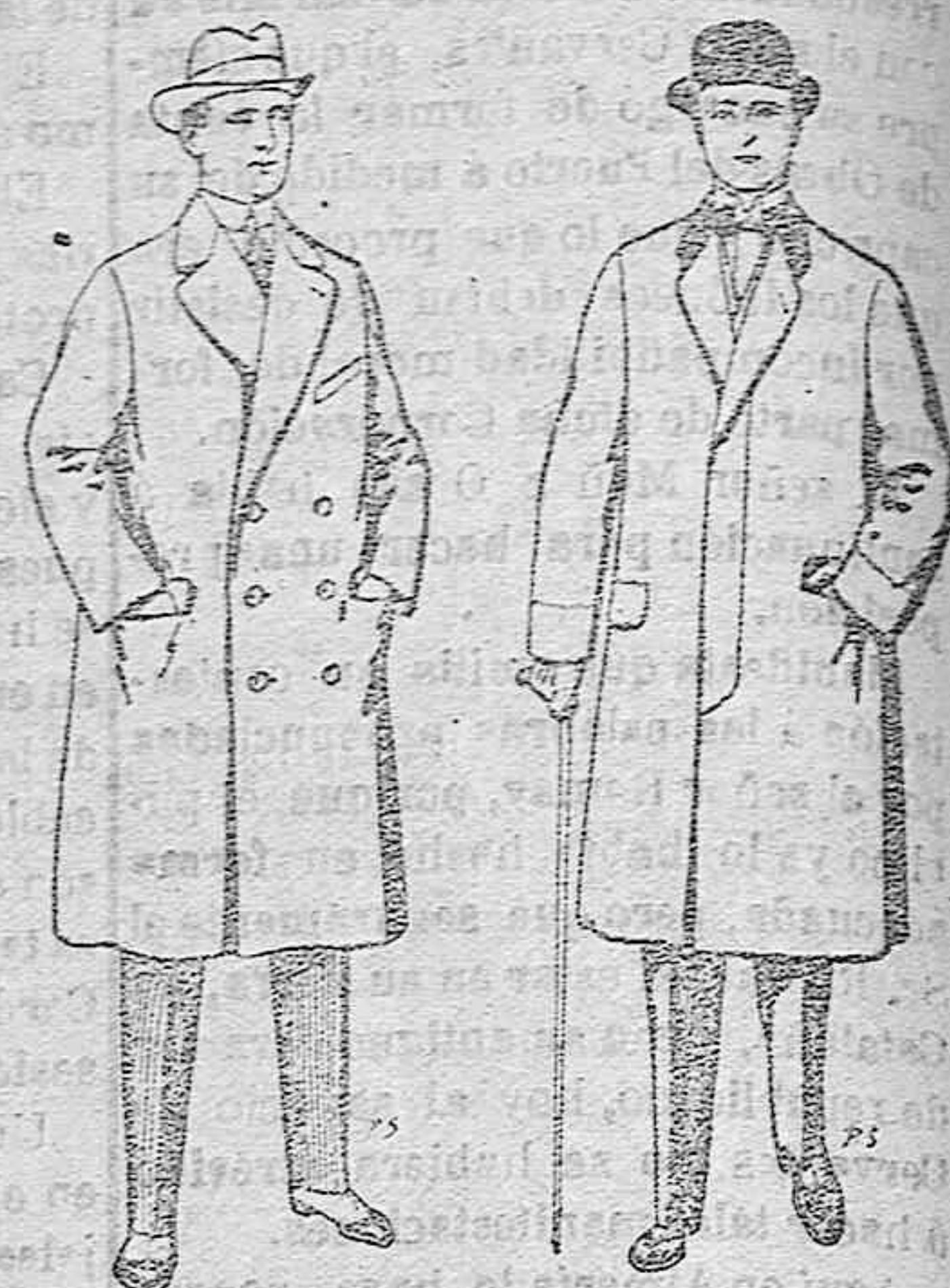
Gabanes de patén cheviot etc. De pesetas 55 á 105 Gabanes de patén, mel-ton y cheviot. De pesetas 25 á 100