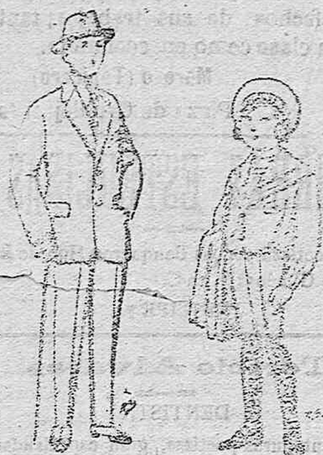
Trajes de patén vicuña ó jerga para niños de 10 á 16 años. De ptas. 14 á 50 Trajes de jergal negra ó azul para niños de 4 á 9 años. De ptas. 5 á 10