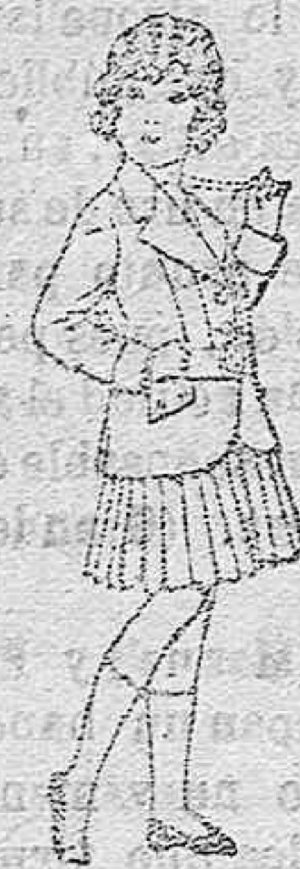
Trajes de lana para niñas de 4 á 12 años. De pesetas 20 á 35 Trajes de lana para jovencitas de 13 á 16 años. De pesetas 40 á 45