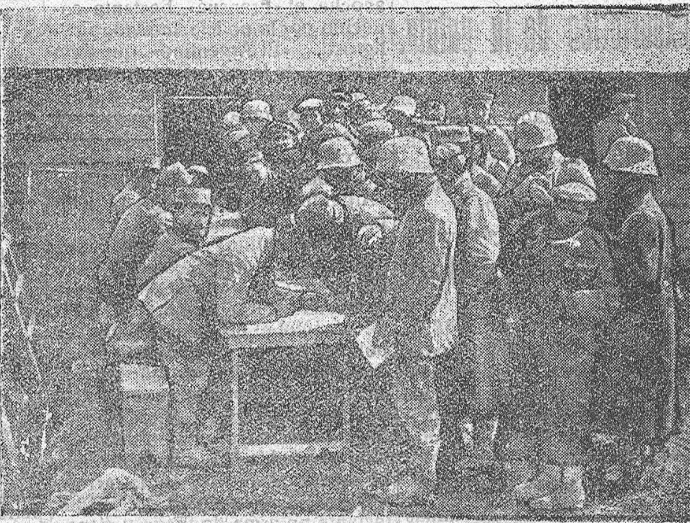
INTERROGATORIO DE PRISIONEROS ALEMANES CAPTURADOS EN LOS ÚLTIMOS COMBATES DEL NORTE DEL AISNE

Café.—Chocolate.— Helados.—Cerveza. Bulevar, 44.