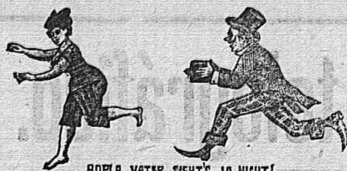
ROELA, WATER, SIERTS JA NIKT! ACCESORIOS FOTOGRAFICOS DE TODAS CLASES Laboratorio 6 Instrucciones, gratis