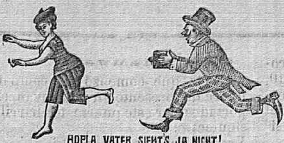
MOELA, WATER, SIEN'S JA NIGHT!

CÁMARAS FOTOGRÁFICAS PROPIAS PARA REGALOS Gran surtido á precios baratos CALLE DE GRANADA NÚM. 25, TELÉFONO 74.