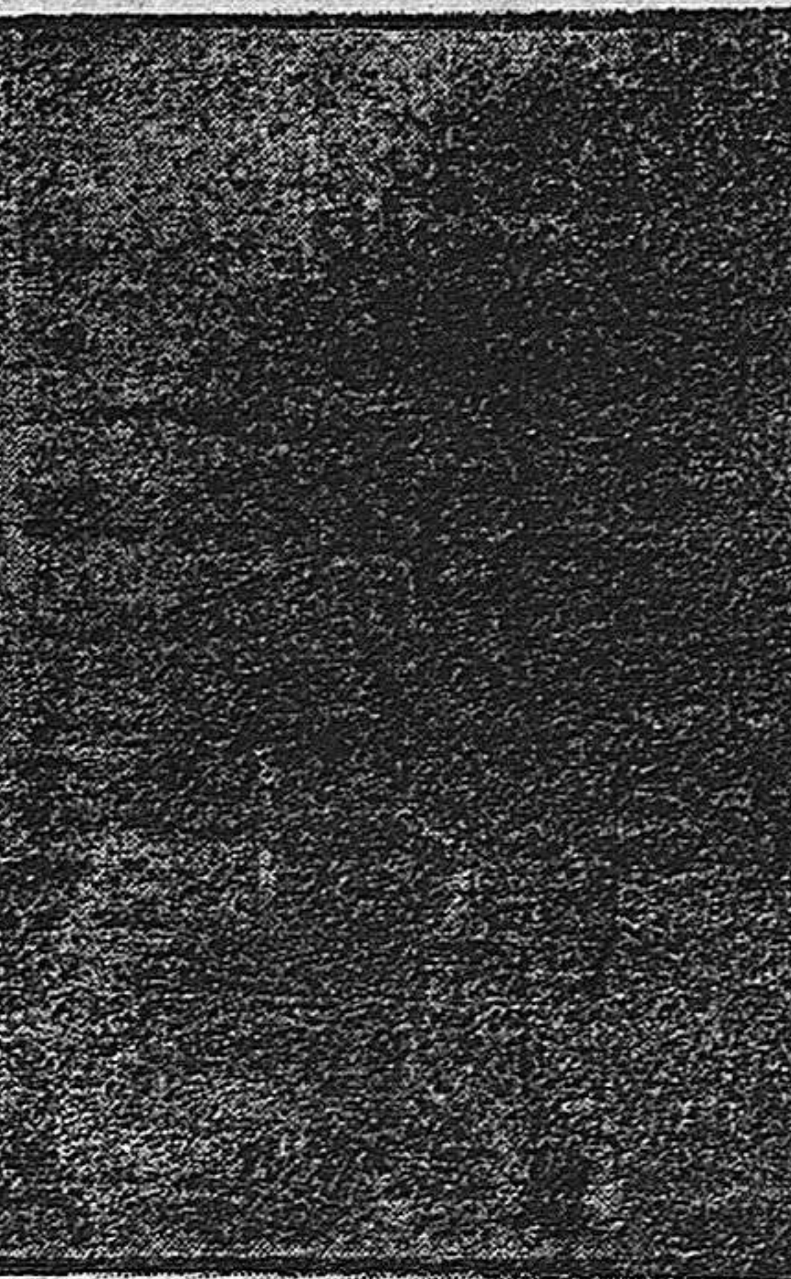
GENERAL SERVIO EN MACEDONIA CONDECORANDO LA BANDERA DEL SEGUNDO DE ZUAVOS

Como entre cosas deben venir siempre firmadas, regamos a estos señores denunciantes nos envíen el mismo comunicado avalado por una o varias firmas y seguidamente lo insertaremos.