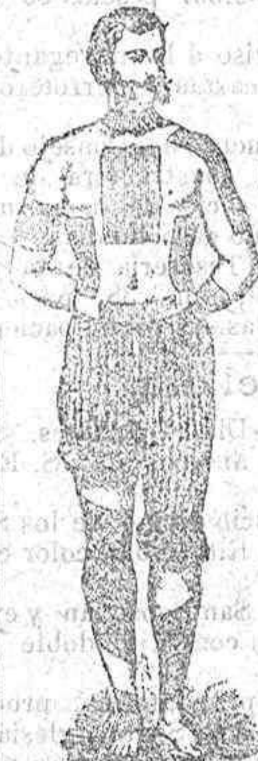
Trade Mark Registered

PERFORADOS AMERICANOS DE FIELTRO ROJO DEL doctor Winter.