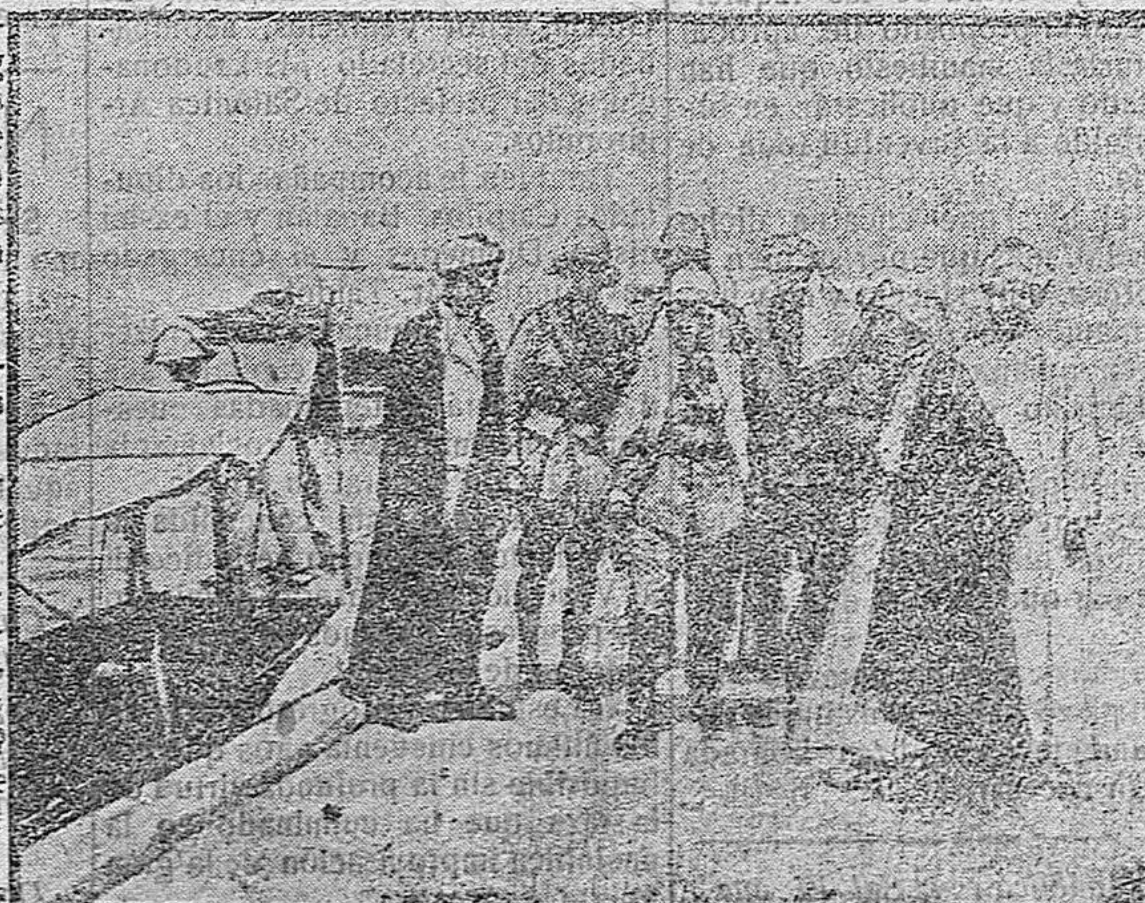
EL GENERAL BAILLOUD EN PALESTINA