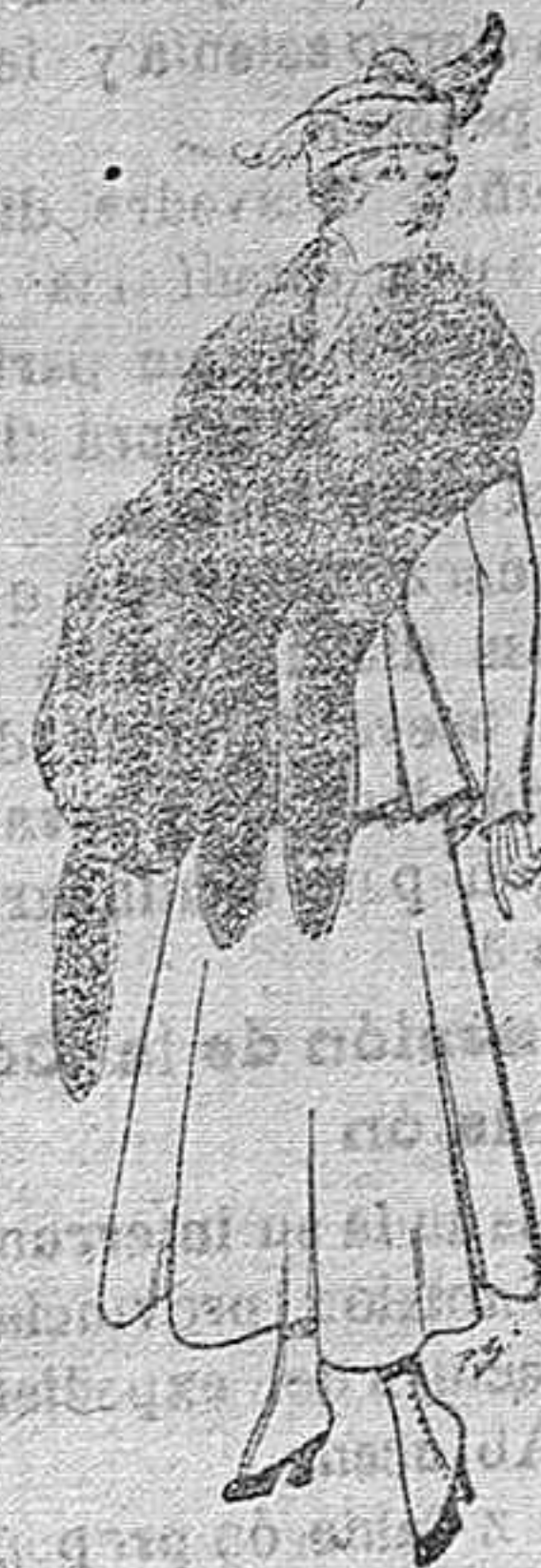
Juego de pieles imitación perfecta al renar negro. De pts. 40 á 4