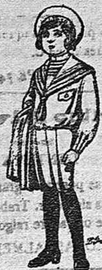
Trajes de jergal negra ó azul para niños de 4 á 9 años. De pts. 5 á 10.