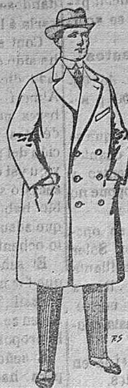
Gabanes de patén cheviot etc. De pesetas 55 á 105