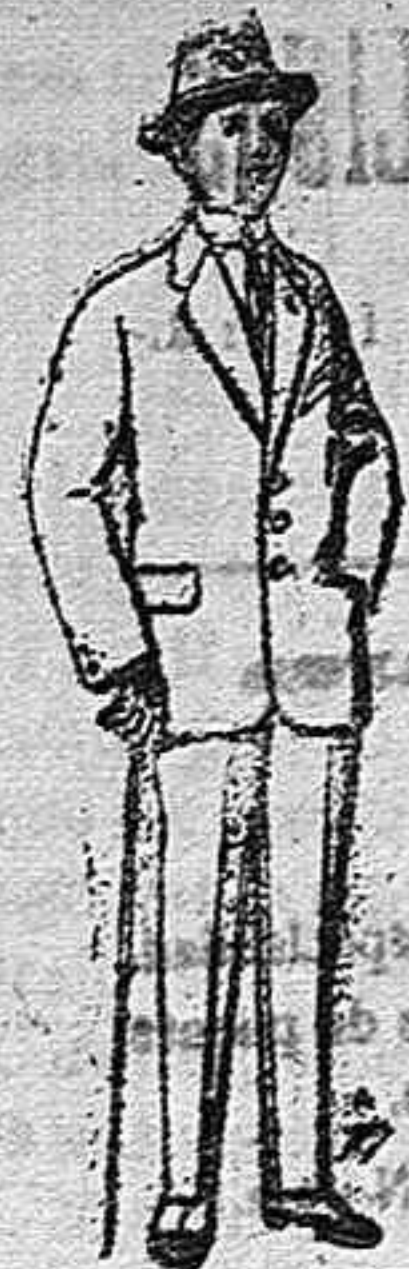
Trajes de patén vicuña ó jerza para niños de 10 á 15 años. De pts. 14 á 50