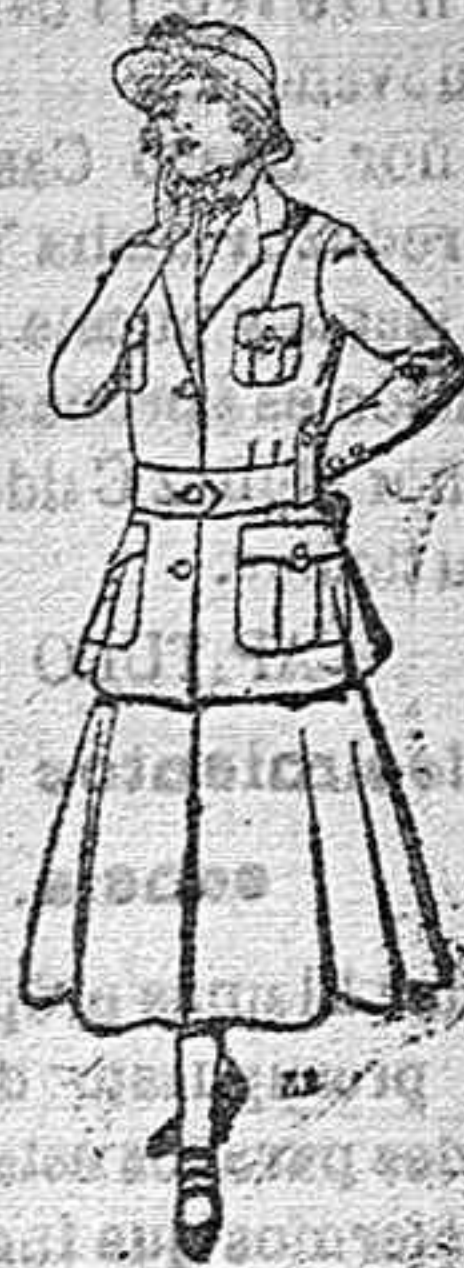
Trajes de lana para jovencitas de 13 á 16 años. De pesetas 40 á 45