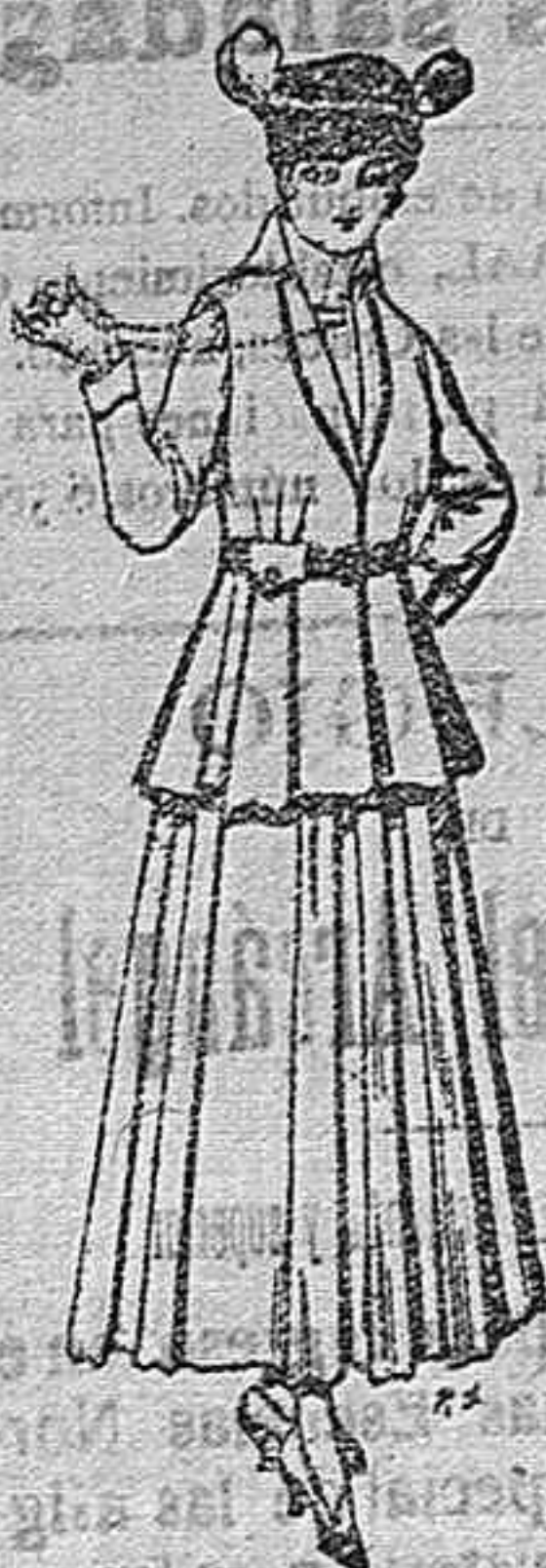
Trajes de lana negra azul y de color, para señora. A pesetas 85.