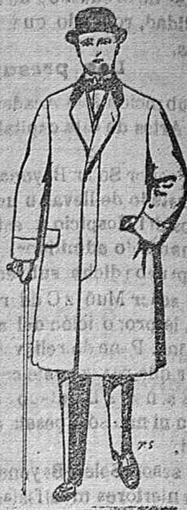
Gabanes de patén, melton y cheviot. De pesetas 25 á 100