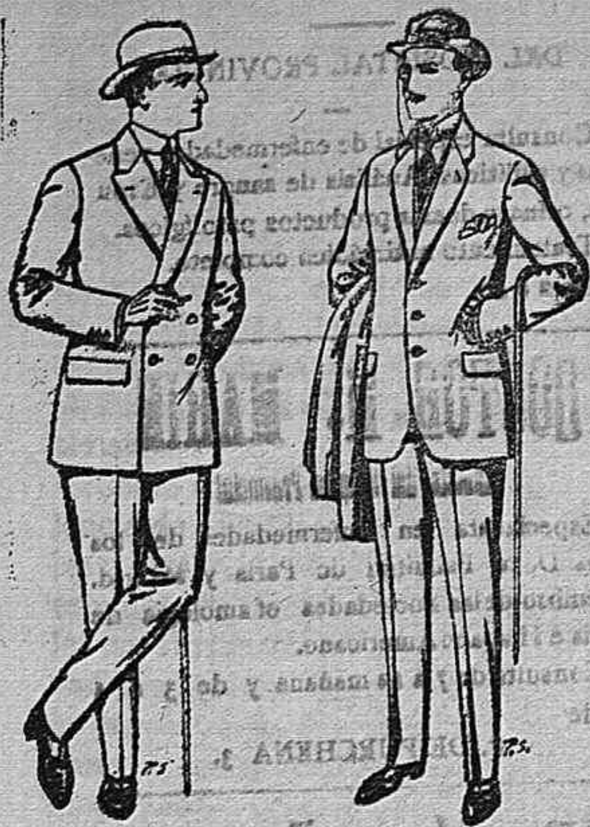
Trajes de cheviot para señores. De pesetas 27 á 35. Trajes de patén cheviot etc. De pesetas 17'50 á 30