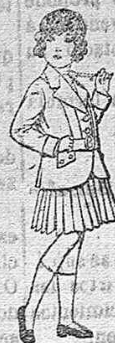
Trajes de lana para niñas de 4 á 12 años. De pesetas 20 á 35