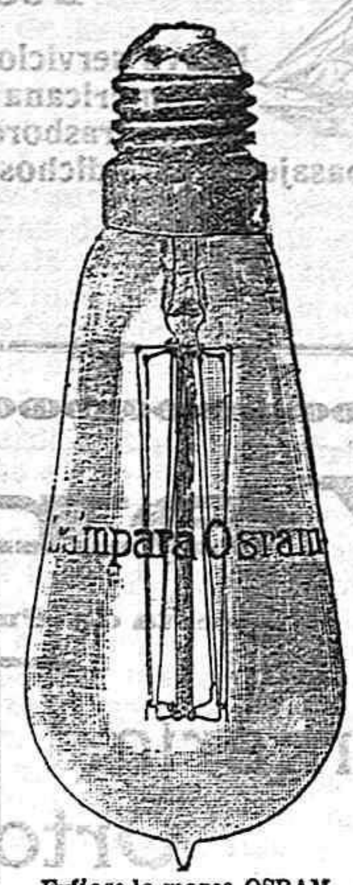
El famoso la marca OSRAM grabada en el cristal.

Finalmente, y en contestación á las numerosas cartas que recibimos, manifestamos, que, á excepción de Madrid, no servimos á provincias ningún pedido para particulares, sino sólo á Centrales y Almacenes.