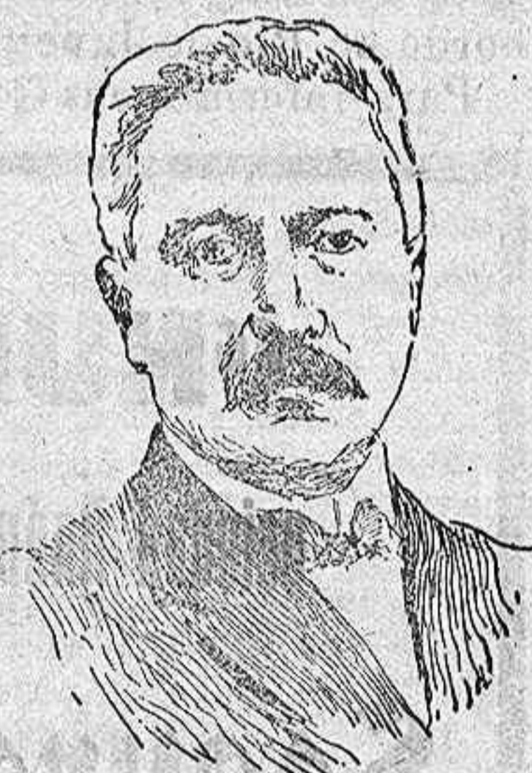
U. E. Orlando, nuevo presidente del Consejo de ministros de Italia.