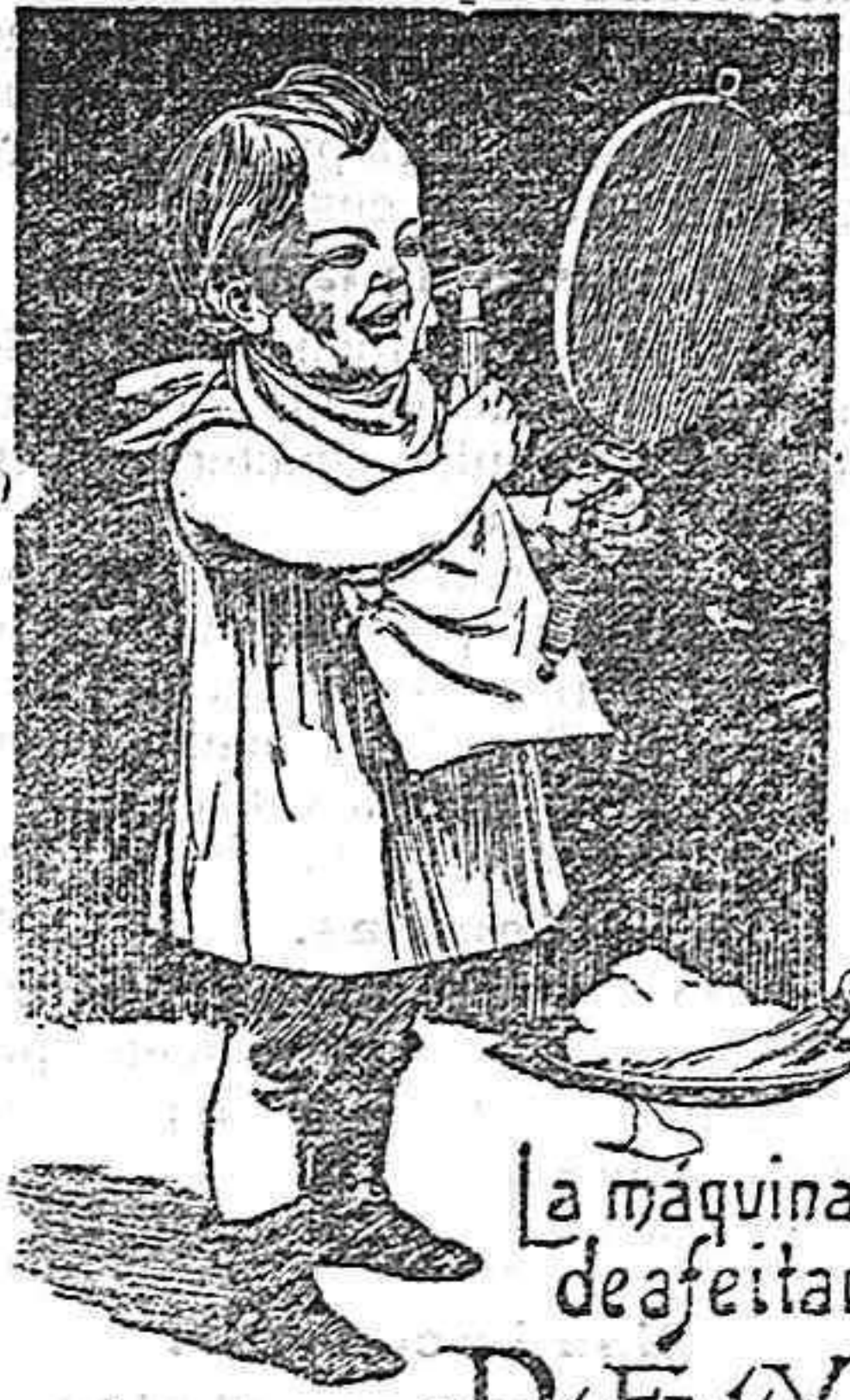
La máquina de afeitar "PHOENIX" es la más segura. Un niño puede manejarla sin peligro.

LABORATORIO: Farmacia de Ortega, León 13, Madrid.— Primera y única fabricación en grande escala de las peptonas y sus preparados por medio del vapor y con todos los aparatos más modernos.