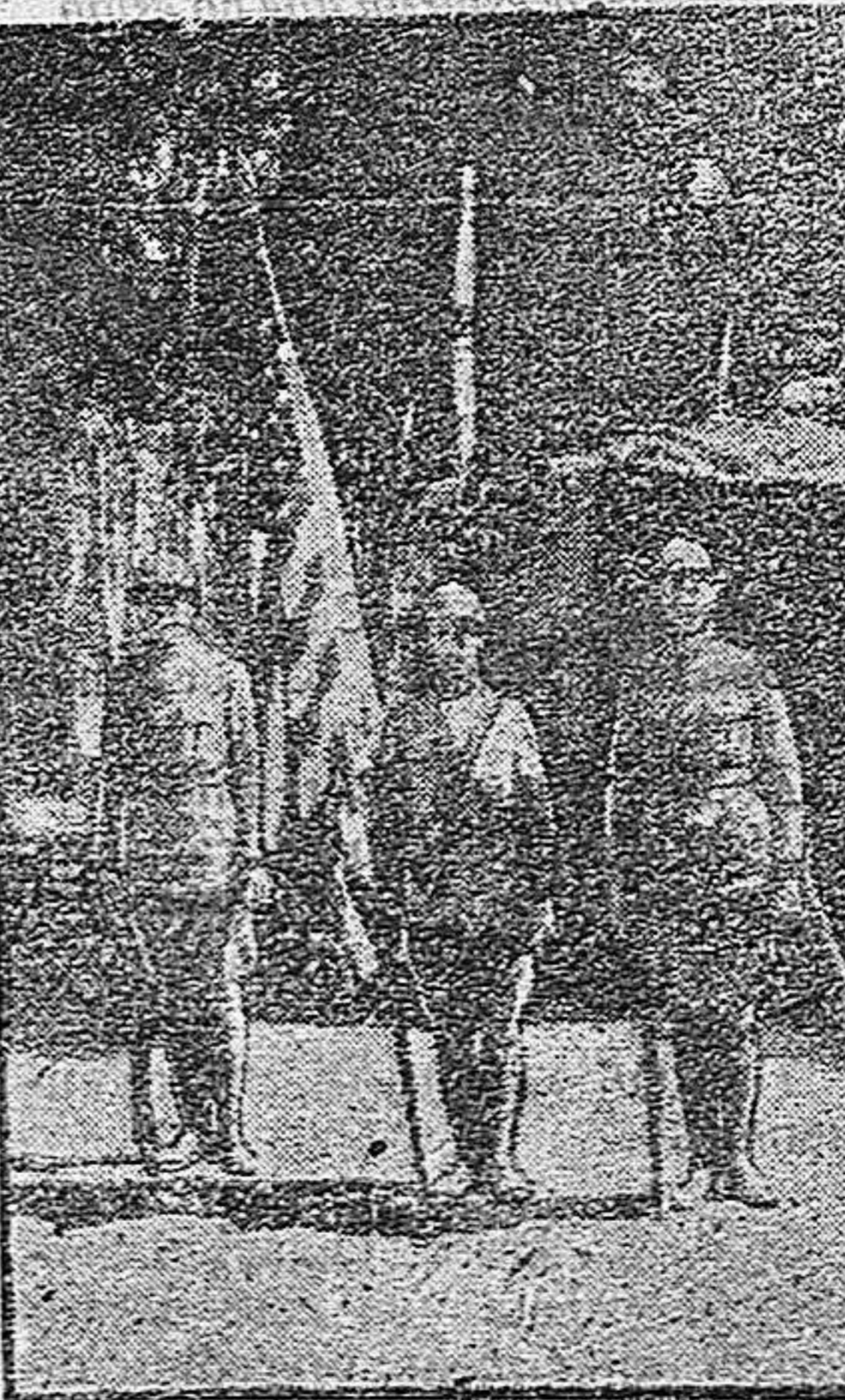
Primera bandera americana de las fuerzas que han desembarcado en Francia.

Señor alcalde: Desde que comenzó el verano un pastor ha hecho corral en un trozo de la calle de Regocijos y allí tiene desde que