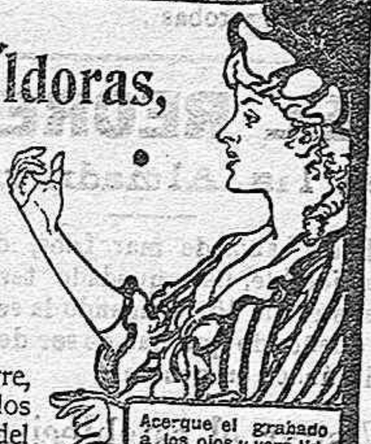
Acuerde el grabado a los ojos y verá Vd. la píldora entrar en la boca.