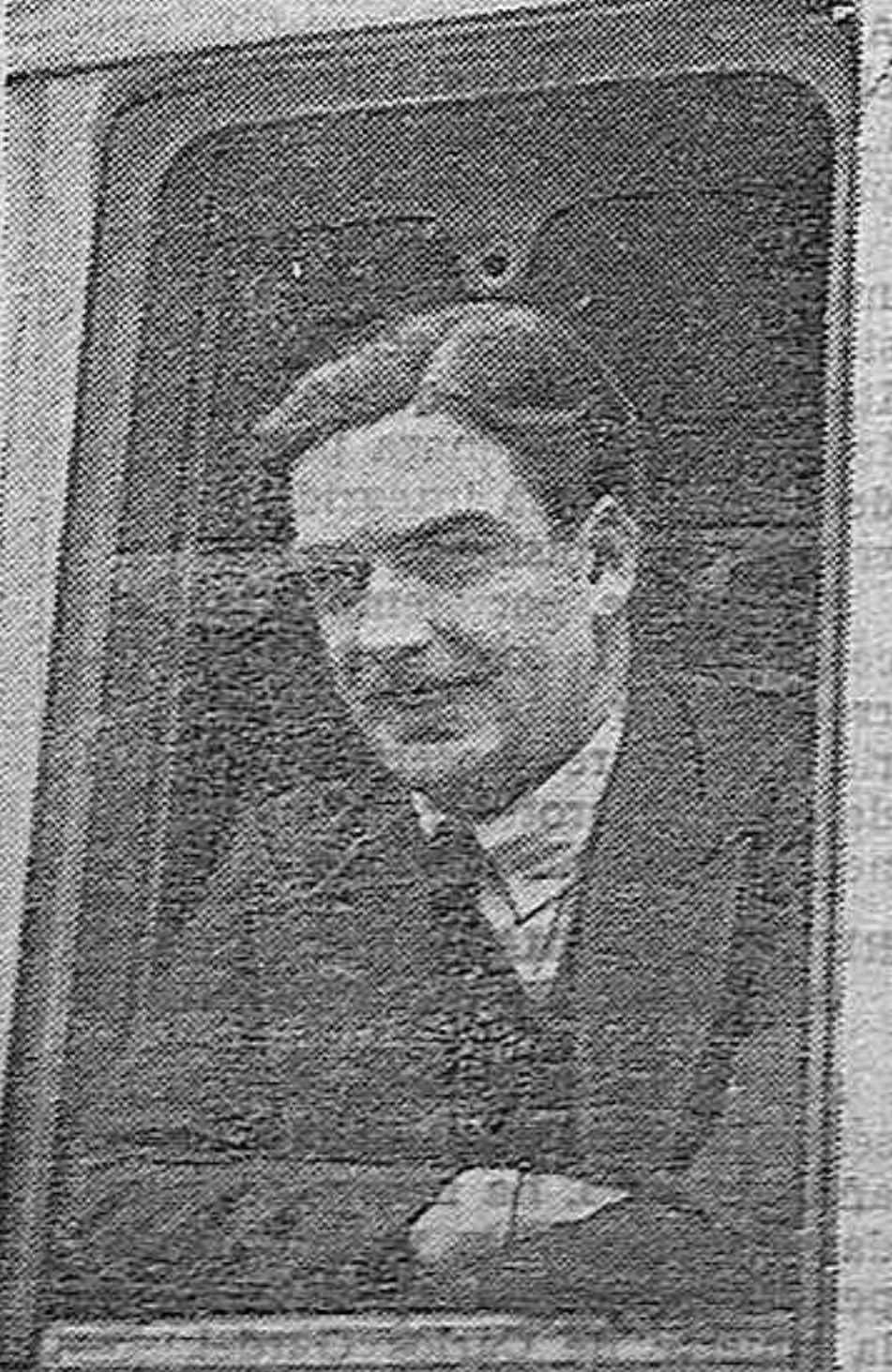
ANTHONY EDEN Lord del sello privado de Inglaterra que tuvo en las recientes conferencias con Mussolini en Roma un brillante éxito por la diplomacia inglesa