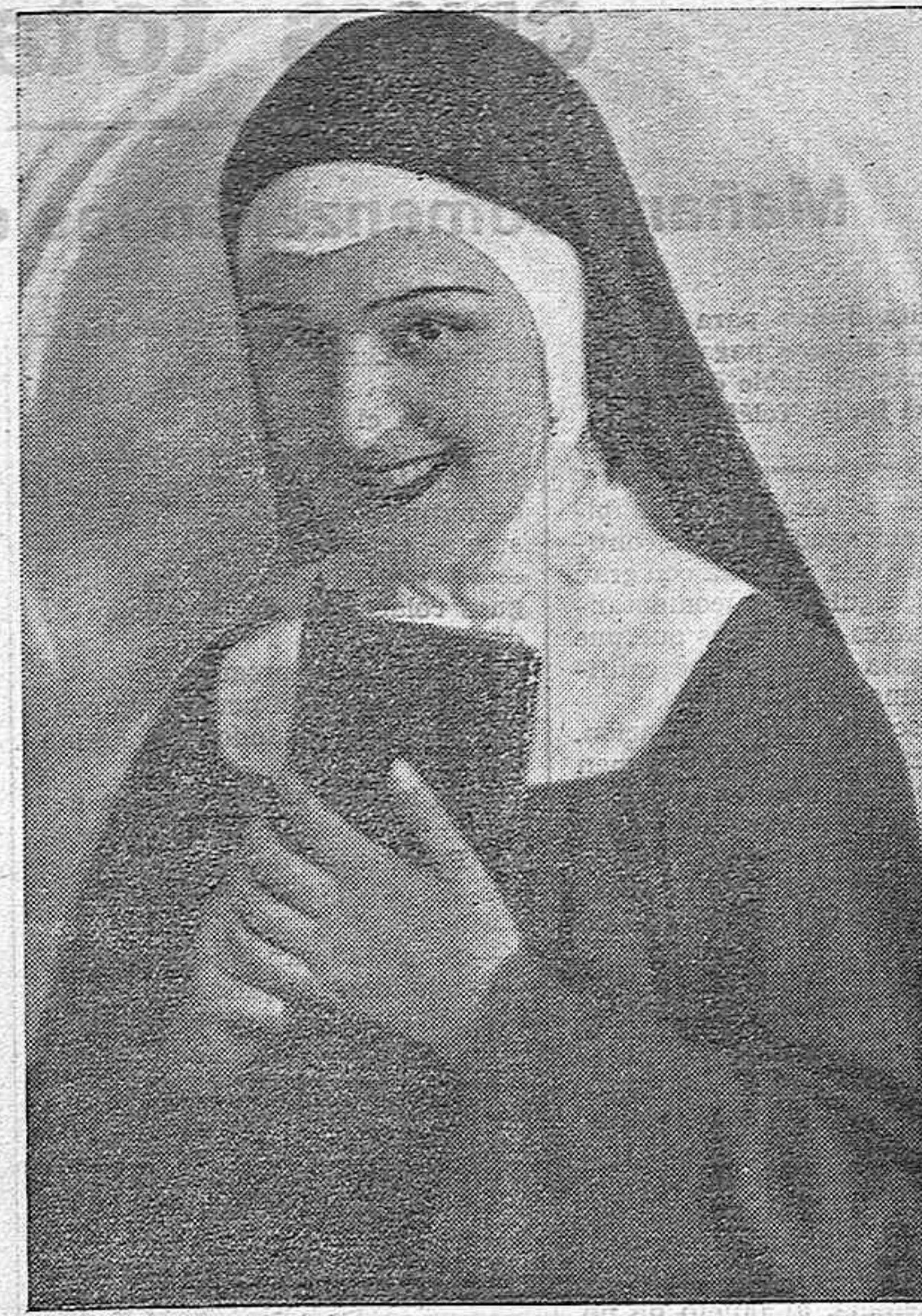
Imperio Argentina la popular «es trella» española que hace una verdadera creación de su «rol» en la película Cifesa «El novio de mamá»