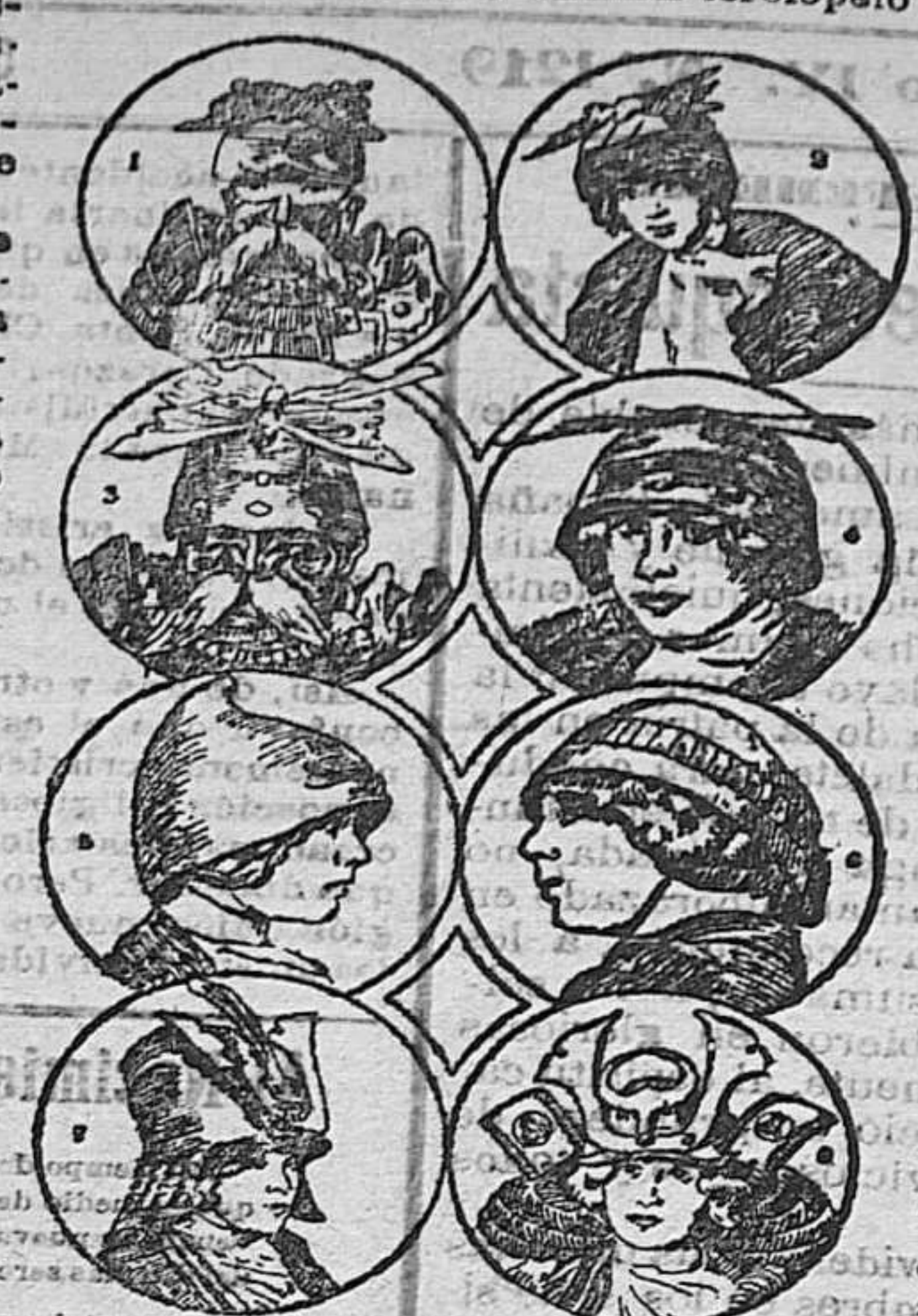
La moda guerrera del viejo Japón y la moda femenina de hoy