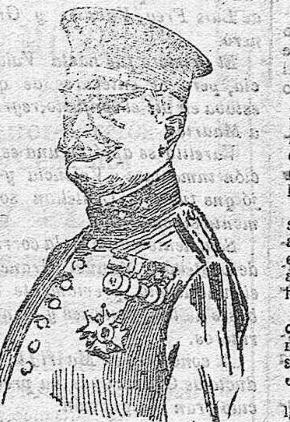
El Capitán General de Sevilla, don Salvador Ariza y Sánchez, que falleció ayer en la capital de Andalucía.