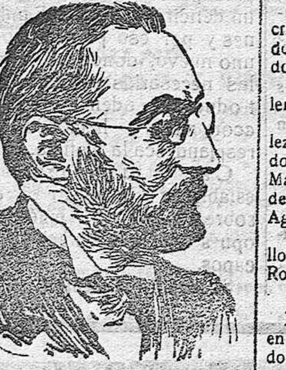
Don Miguel de Unamuno, procesado recientemente por el delito de lesa majestad y que acaba de ser condecorado por el Gobierno Argentino.