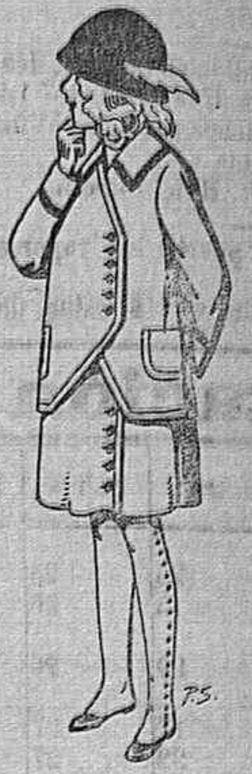
Traje para niñas de 4 a 11 años De Ptas. 14 a 17