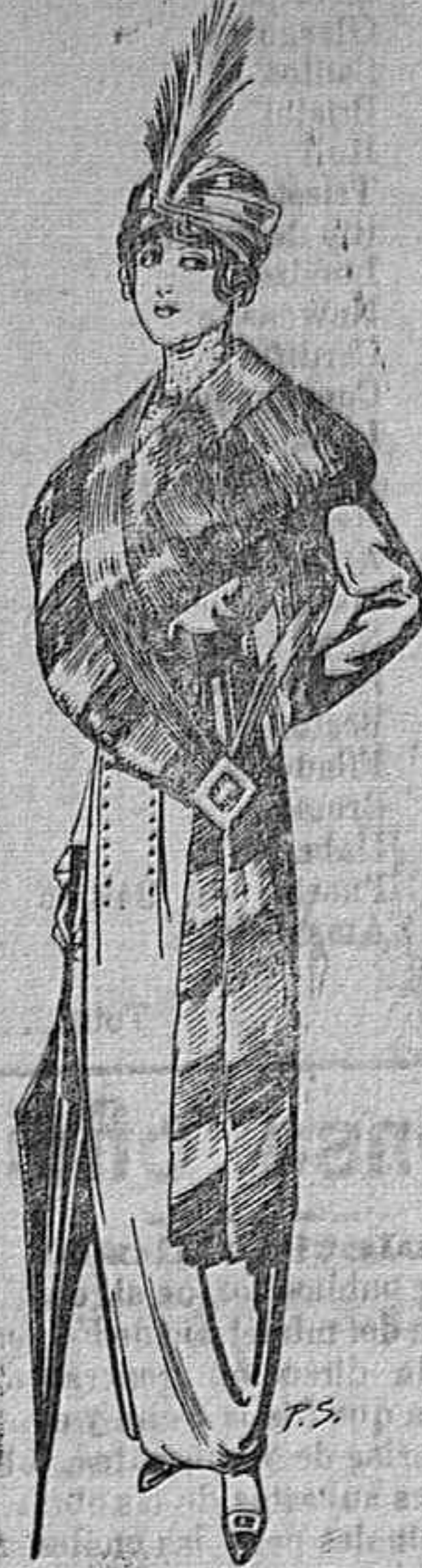
Juego de pieles para señora, de taupe Australia A Ptas. 155