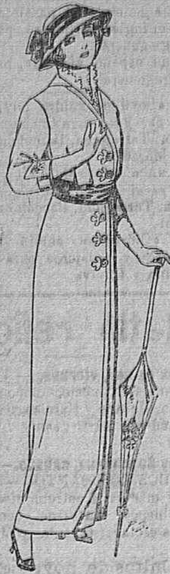
Vestido de lanilla negra o azul para señora A Ptas. 22