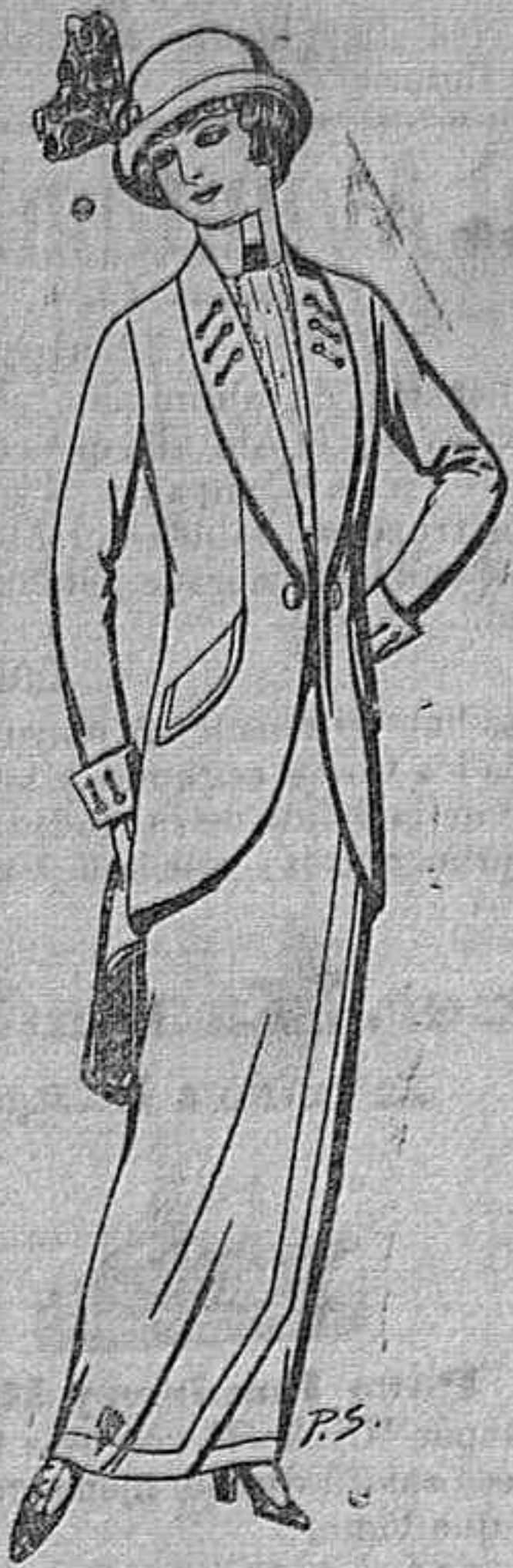
Traje de lanilla o cheviot para señora A Ptas. 65 y 70