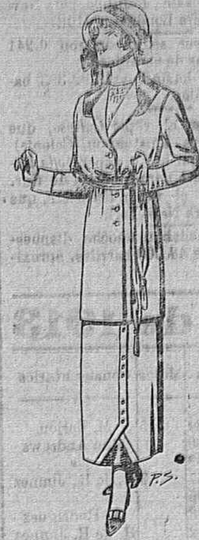
Traje de lana para jovencitas de 14 a 16 años De Ptas. 40 a 45