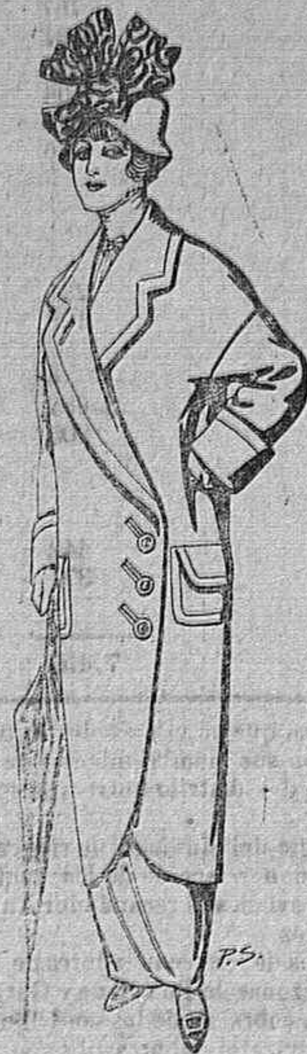
Abrigos de patén para señora De Ptas. 22 a 30