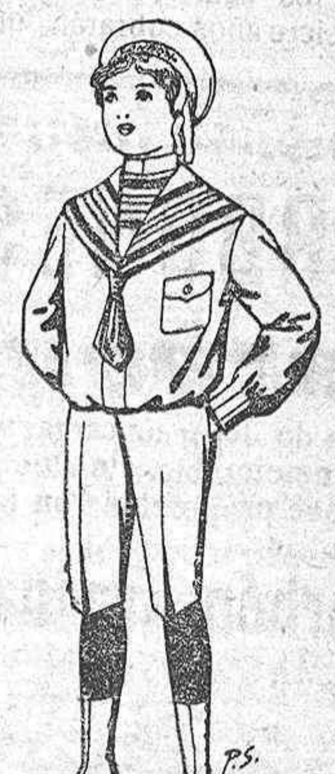
Trajes de jerga azul o negra niños de 4 a 9 años De pesetas 10 a 26