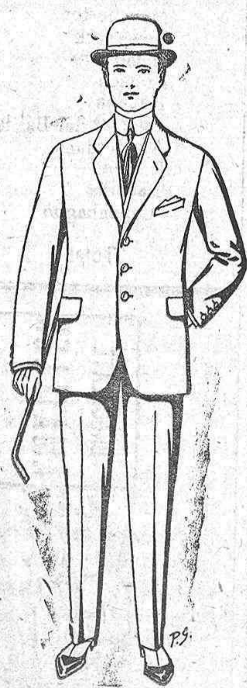
Trajes de paten, cheviot, etc. De pesetas 25 a 30