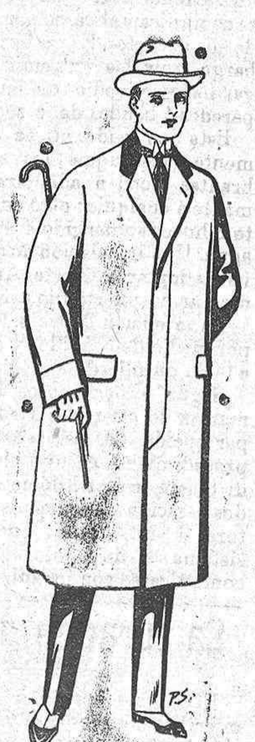
Gabanes de paten, cheviotto molton De pesetas 25 a 100