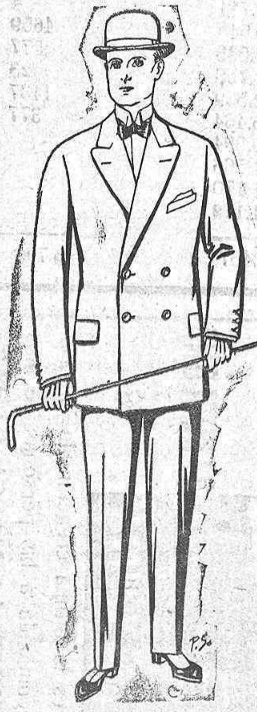
Trajes de cheviot, paten, etc. De pesetas 17'50 a 70