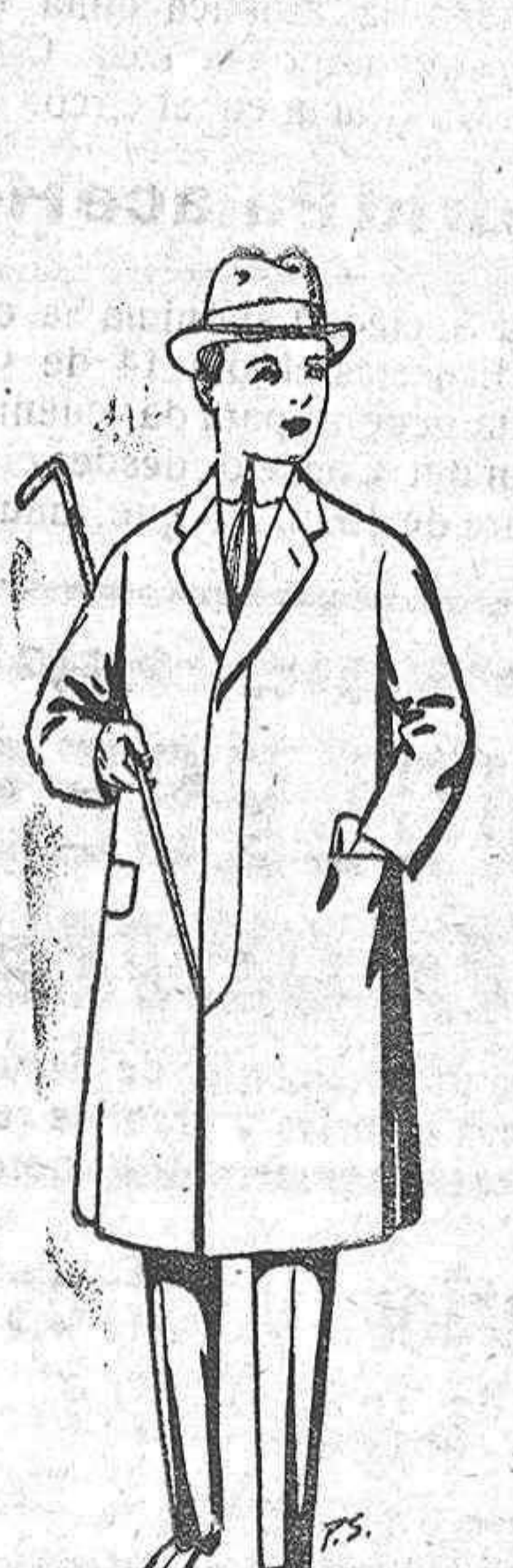
Gabanes de lana para juveniles de 10 a 16 años De pesetas 14 a 50