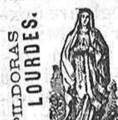
PILDORAS DE LOURDES.

En esta afortunada Administración además de los billetes de la Lotería nacional, se expenden de las acreditadas rifas del Niño Jesus, del Pardo y Nuestra Señora de la Asuncion, de las demas ni se venden, ni se pagan sus premios.