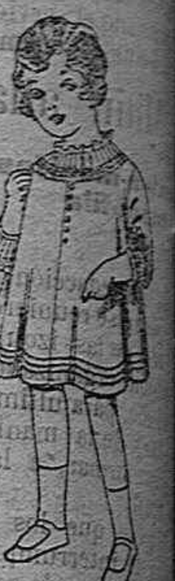
Vestidos de lana blanca...

Géneros del país y extranjeros para la Sección de Medida. Sombreros de paja de 2'50 a 12 pesetas.