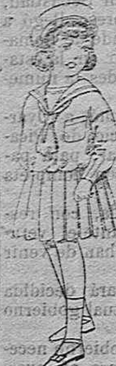
Trajes de marinera de lanilla azul para niñas de 4 a 9 años...

Camisería, Géneros de punto, Corbatería, Guantería Sombrereria, Zapatería, Paraguas, Baskets y Artículos de viaje.