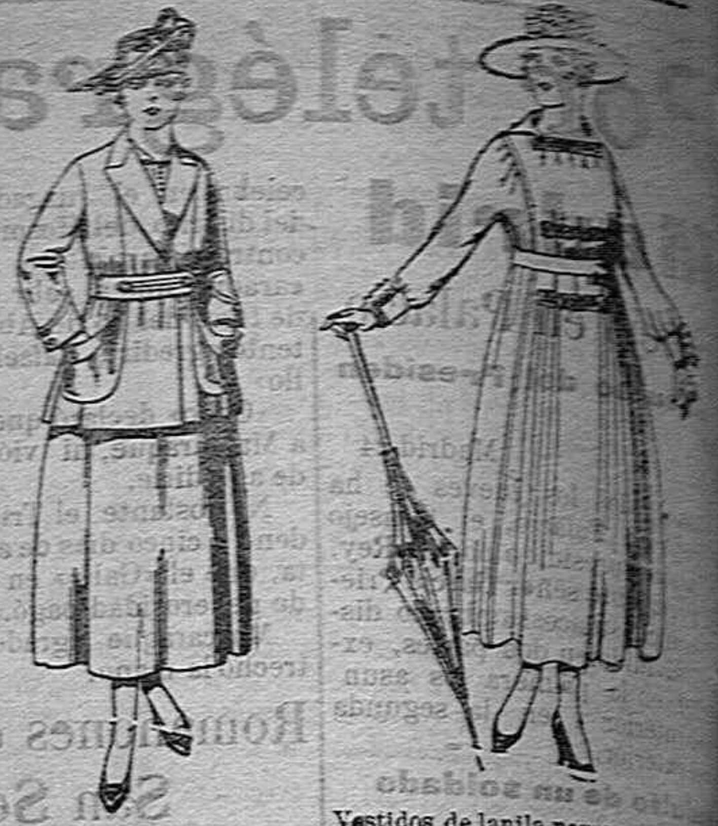
Traje de estambre negro, azul y color... Vestidos de lanilla negra, azul...

SUCURSALES: Madrid, Barcelona, Alicante, Almería, Bilbao, Cádiz, Cartagena, Gijón, Granada, Málaga, Palma de Mallorca, Santander, Sevilla, Valencia, Valladolid, Zaragoza.