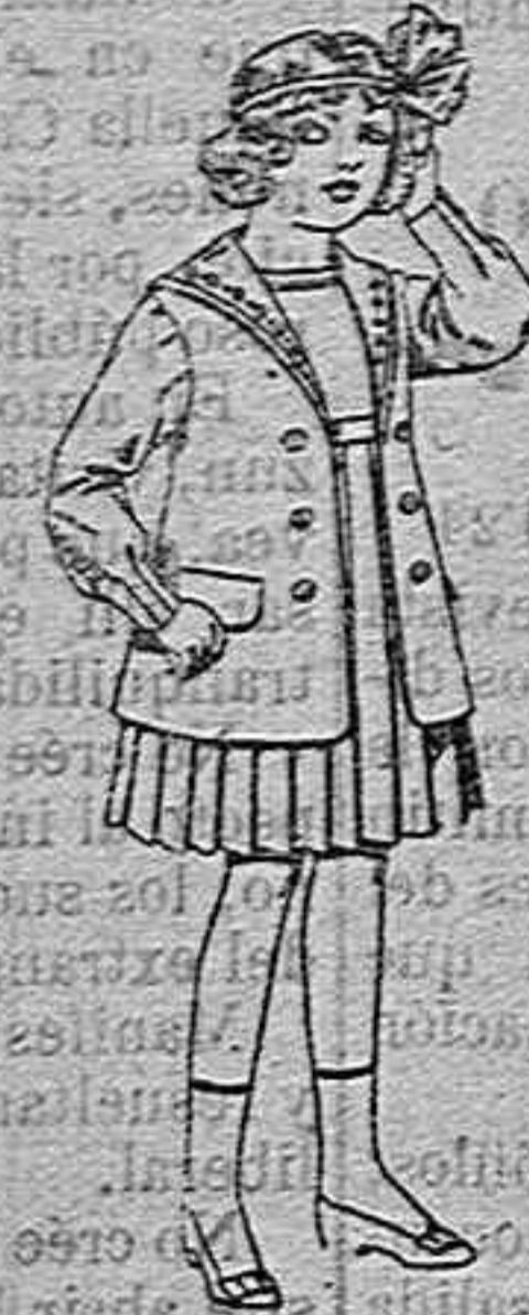
Traje de gabardina, blanco, cuello de orhándin bordado...