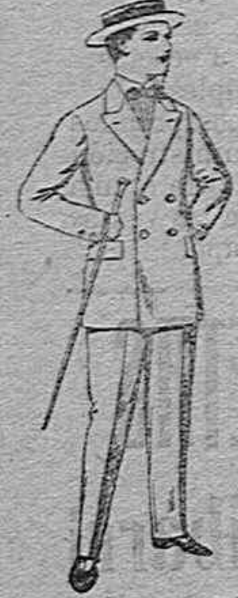
Traje de estambre, vicuña o jerga, para jovencitos...