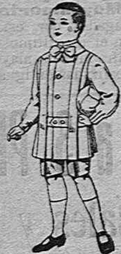
Trajes de lanilla para niños de 4 a 9 años...