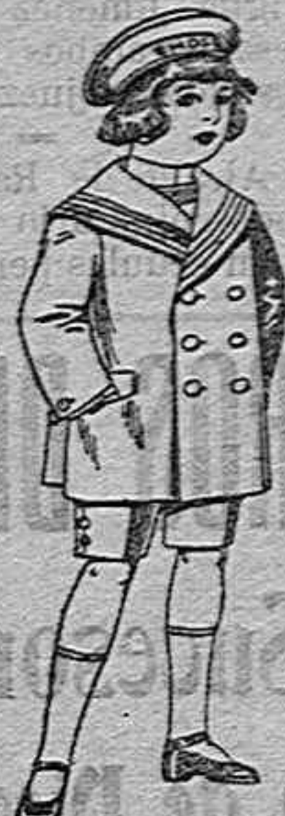
Trajes matelot de vicuña jerga azul para niño de 4 a 9 años...

Ropas confeccionadas para caballero, señora, niño y niña.