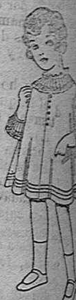
Vestidos de vicuña o jerga blanco bordado de ptas. 60 a 70.

Géneros del país y extranjeros para la Sección de Medida. Sombreros de paja de 2'50 a 12 pesetas.