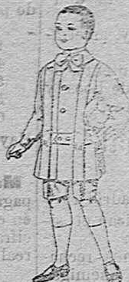
Trajes de lanilla para niños de 4 a 9 años. de ptas. 12 a 31