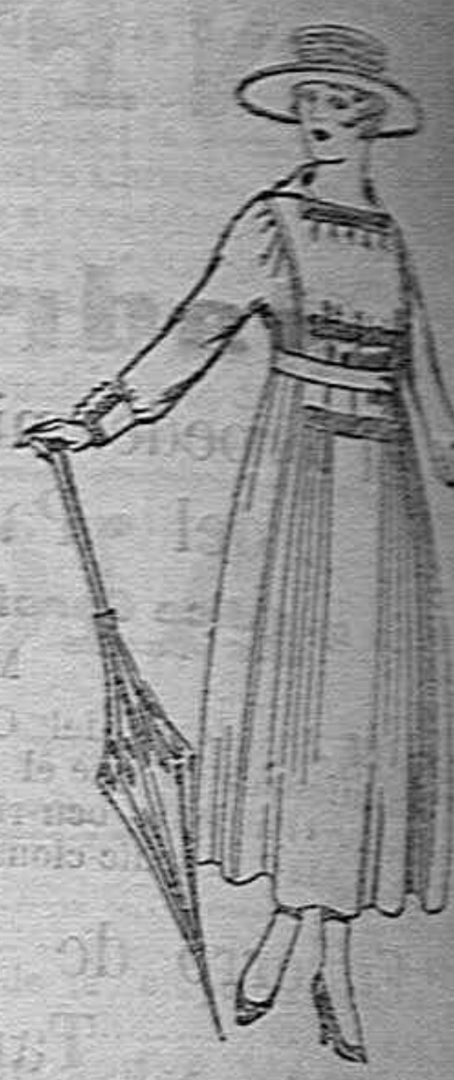
Vestidos de lanilla negra, colores de ptas. 60 a 70.