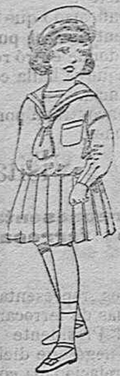
Trajes de marinera de lanilla azul para niñas de 4 a 9 años de pesetas 32 a 38 los mismos de dril blanco de 13 a 24 pesetas.