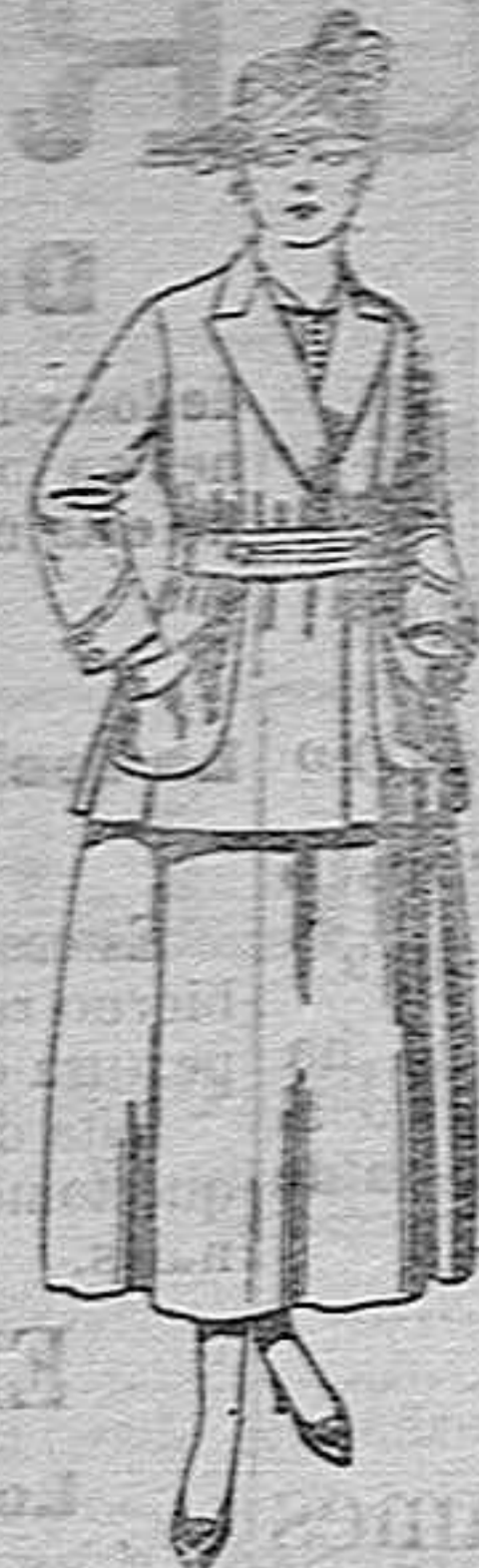
Traje de estambre negro, azul y color. de ptas. 70 a 70.