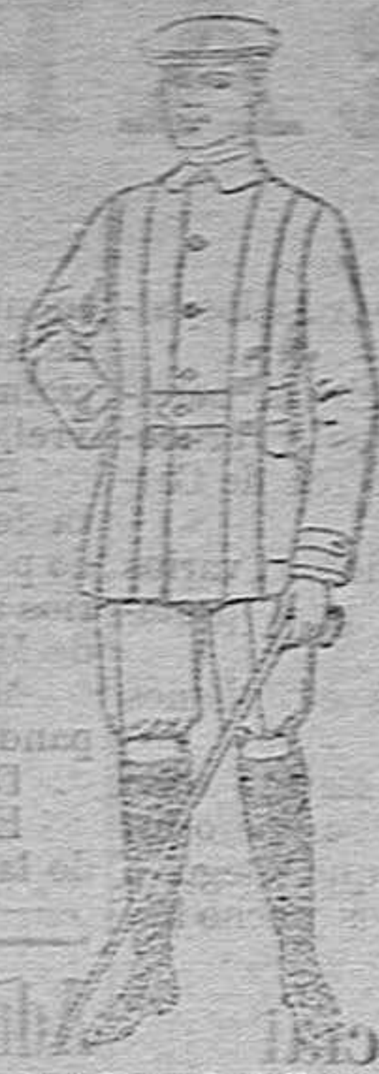
Cazadoras de dril crudo o kaki de ptas. 12 a 24. Pantalones cortos pa. sportman de dril beige de ptas. 8 a 12.