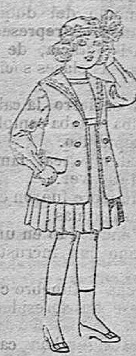
Traje de gabardina blanco, cuello de orhándin bordado, para niñas de 4 a 9 años. de pesetas 22 r 24.