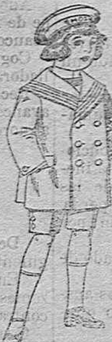
Trajes matelot de vicuña o jergal azul para niño de 4 a 9 años de 14 pesetas a 32.