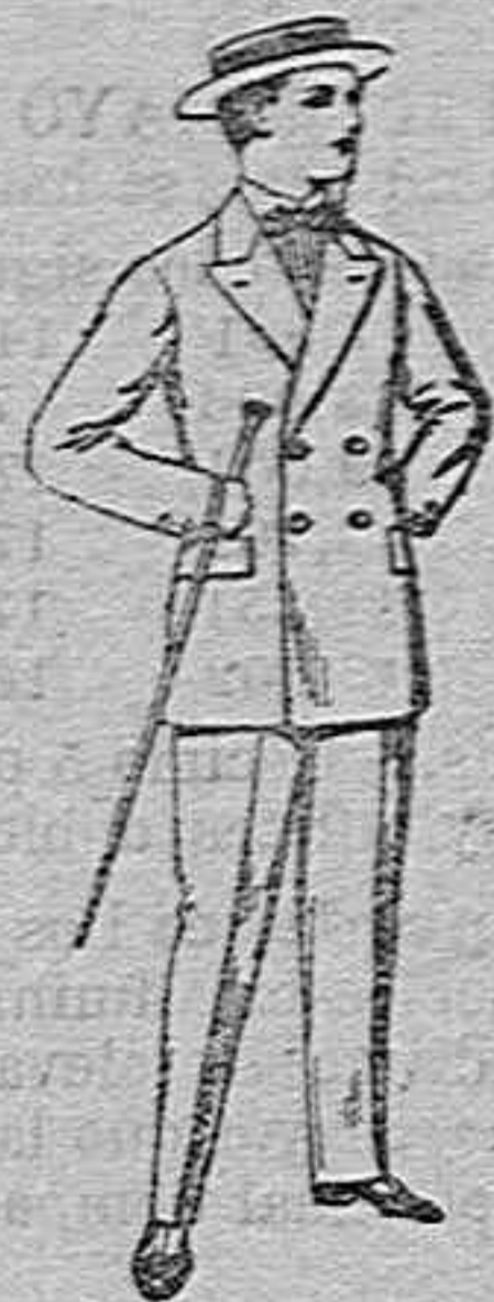
Traje de estambre, vicuña o jerga, para jovencitos de 10 a 17 años. de ptas 19 50.

Camisería, Géneros de punto, Corbatería, Guantería Sombrereria, Zapatería, Paraguas, Bastones y Artículos de viaje.